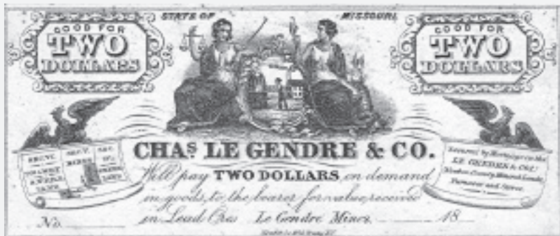
圖1 李仙得礦業公司發行之鈔票 28

李仙得在《臺灣紀行》第一冊中提及1857年旅行至密蘇里西南一事。 24 根據美國土地管理局的資料，顯示出李仙得夫婦在牛頓郡擁有數筆四十英畝的土地， 25 其中分別於1857、1858、1859年成為葛蘭比鉛礦所屬產業的土地。 26 李仙得企業私自發行的紙鈔，只有少數留下，如圖1所示的兩元鈔票。除此之外，這項投資再無其他資料留下來，因此無法確定他在礦業投資事業中的獲利情況。透過李仙得的書信，可以得知他有時欠債，且他妻子克拉拉死時幾乎身無分文，因此可以推知，李仙得夫妻二人不可能從開礦事業中獲得多少財富，也無法得知他或克拉拉到底持有該產業多久。他們名義上仍擁有這些土地所有權將近三十年，因為在1882年牛頓郡的土地測量圖上，仍有兩筆土地屬於「Legendre」名下產業。 27 雖然李仙得曾經試圖於美國南北戰爭後的紐約州與1880年代的朝鮮再度經營礦業，但密蘇里的鉛礦可能是李仙得在他歷次的採礦事業中投入最多精力的一次。