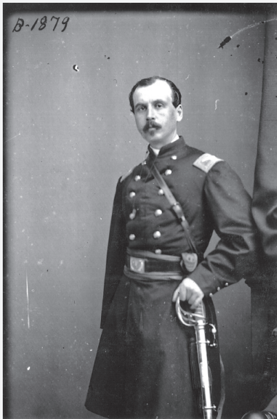
圖2 李仙得上校 31

李仙得在美國南北戰爭前的生活資料很少，但自從1861年歲末戰爭爆發之後，他進入公家的記錄中起，此後多半的歲月裡，李仙得始終活躍於軍旅、外交、旅行、探險。他在戰爭期間結識的軍方及民間領袖，都成為他在1866年戰後尋求外交官職的助力。李仙得支持北軍訴求，分別於1862年及1864年遭受嚴重傷害，包括頭部、下顎及頸部，兩次都幾乎命喪槍下； 29 第二次受傷中，使李失去鼻樑與左眼，並就此結束其軍旅生涯。他復原之後，雖仍活躍於工作，但從他在中國及日本時的通訊中，時而可見李抱怨戰時傷勢所遺下的疼痛。李仙得於1864年10月退伍、1865年3月戰爭結束前一個月授勳為名譽准將。這份榮譽使他在日後的外交事業中得以被尊稱為「李仙得將軍」。 30