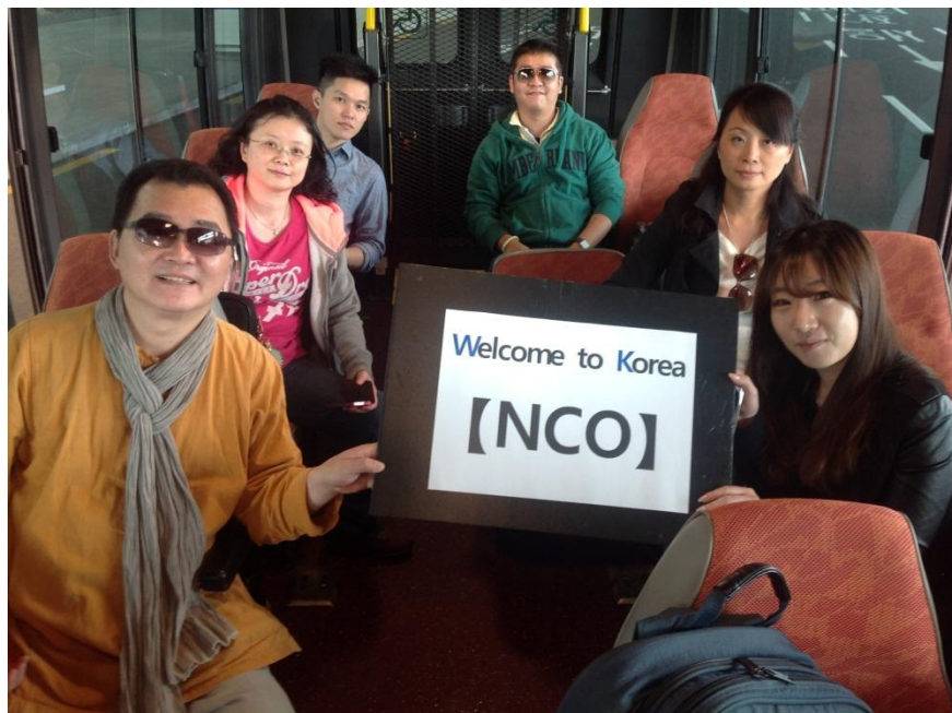
臺灣國樂團成員抵達韓國。