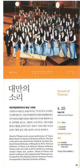
↑ 韓國國立國樂管弦樂團 2013-2014 樂季手冊