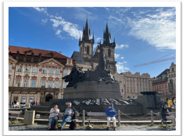
圖六：舊城廣場上的胡斯雕像與胡斯教派的信徒們。

捷克議員米洛斯拉夫曾說：「它(無神論)也有其不可否認的優點……捷克人基本上以世俗的方式看待世界。這件事很不錯—依靠自己的力量，不要指望任何奇蹟。在歷史上，它多次不僅幫助我們生存，而且還積極塑造我們的歷史。馬薩里克曾說過，要了解哪些歷史是最偉大的，看地圖就夠了。」