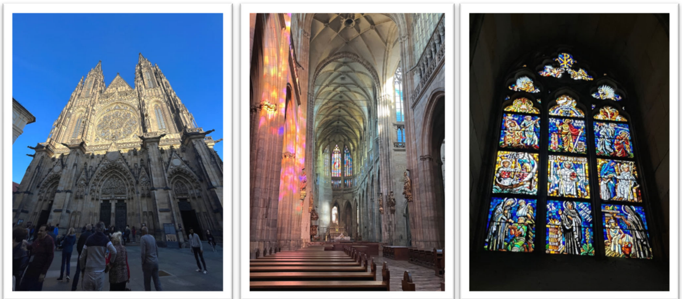
左起圖三：布捷克最大的教堂聖維特教堂位在拉格城堡內；圖四：教堂的內部；圖五：教堂上的窗花。

天主教會視胡斯為「異端」，開除他的教籍，繼而誘捕，在1415年7月6日，將胡斯燒死在火刑柱上。這起事件，引起胡斯的追隨者(胡斯教派)的憤怒，並進一步起義，對抗羅馬天主教會與支持天主教的神聖羅馬帝國中央政府，胡斯戰爭就此展開。