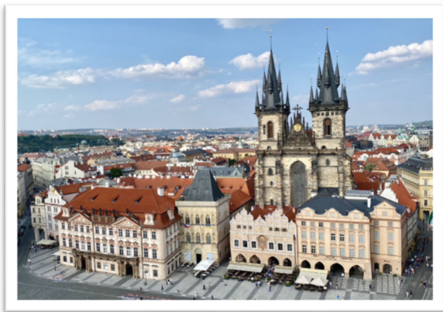
圖一：舊城廣場上的提恩教堂。

研究指出，捷克人的「無神論」可能與捷克過去被共產黨統治有關。過去，「打壓宗教」是共產黨的策略，目的是對抗任何可能挑戰的組織，例如天主教會。