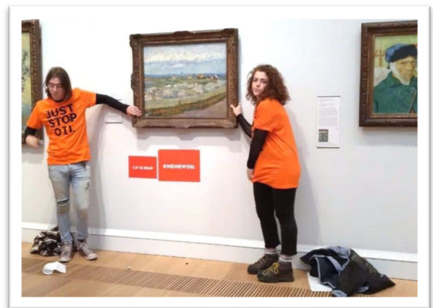
圖一：將塗有膠水的手黏在梵谷《盛開的桃樹》畫框的抗議者。

這也是為什麼梵谷的《盛開的桃樹》會成為目標？當時正值法國普羅旺斯地區，因冬季乾燥與熱浪等因素恐面臨乾旱危機。抗議者便想藉由這幅描畫南法亞爾(Arles)田野風情的畫作提醒世