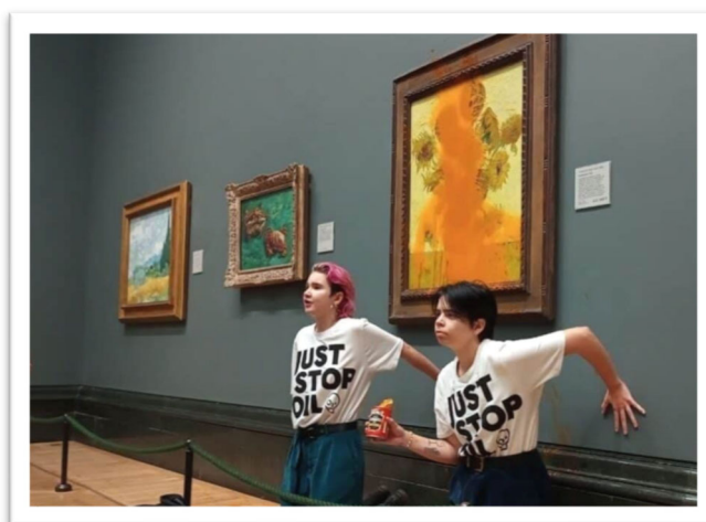
圖二：對著梵谷的《向日葵》潑灑蕃茄湯的抗議者。

另一方面，面對層出不窮的藝術破壞事件，國際博物館協會(International Council of Museums, ICOM)也在2022年11月9日發表