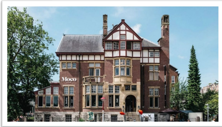
圖三：莫科博物館(圖片取自官網)。