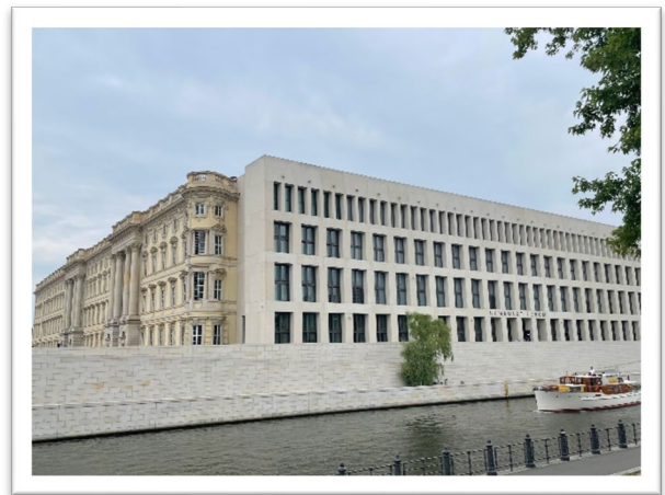
圖二：洪堡論壇外牆有兩種建築風格。