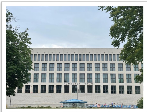
圖一：洪堡論壇的東側面。

關閉的共和國宮位於柏林的市中心，同時又富含歷史意義，當然是德國人民討論的焦點。民眾的輿論主要分為兩個觀點：清除石棉後重新開啟共和國宮、重建柏林宮。德國聯邦議會在議論紛紛之際，終於為這塊土地的未來擬定了初步的方針：拆除共和國宮，並於2008年正式啟動柏林宮重建國際設計比賽（International Design Competition for the Reconstruction of the Berliner Schloss），邀請世界各地的建築團隊角逐盛大的重建設計比賽。