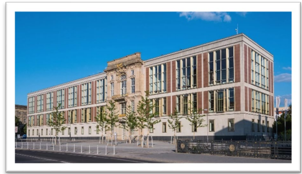
圖四：東德當年的國務院大樓。

今日位於柏林市中心的洪堡論壇，是個會讓人想一再拜訪的博物館群，除了寬敞的展覽空間、豐富的藏品，新穎且別具特色的混合風格建築也總是讓人意猶未盡。在了解柏林宮重建國際設計比賽之後，才發現原來有這麼多的建築團隊透過設計，來呈現自己對重建的看法和做法。今天，洪堡論壇的 Agora 沒