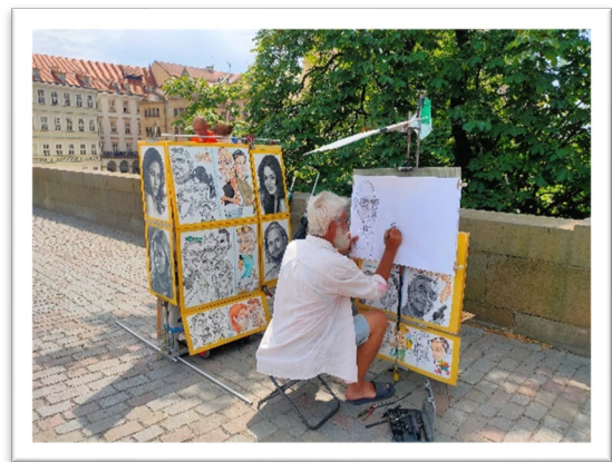
圖三：位於查理大橋，富有個人風格的似顏繪插畫家。

從遊船上觀望查理大橋是一個新鮮的體驗，實際走訪後更能體會到這個有歷史歲月的橋樑魅力。除了精美的雕塑外（雖然現今能看到的都是複製品，原作需於國家博物館欣賞），也有數個以販售似顏繪和風景作品維生