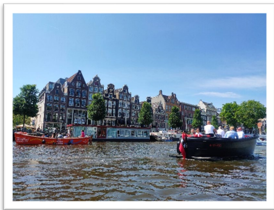
圖二：在船隻上熱絡打招呼的人們。

搭乘火車，從德國來到捷克的首都——布拉格，迎接我們的是金黃的夕陽，灑落在一大片的植被上。由於停留的時間不長，行程上必