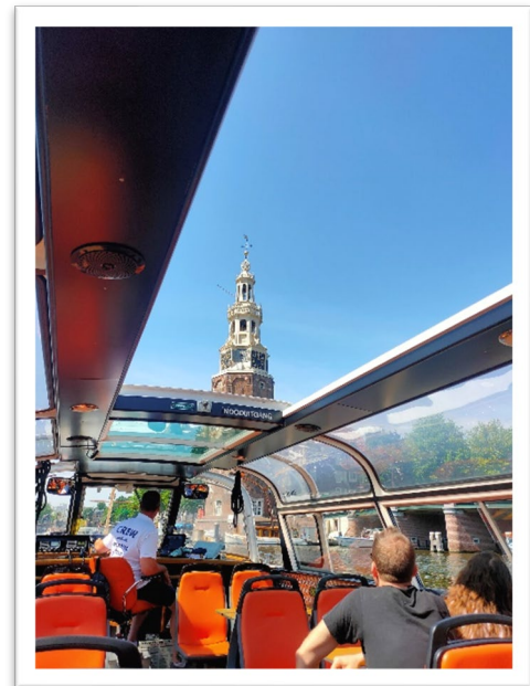
圖一：以橘色作為主要色調的荷蘭遊船。

在實際抵達荷蘭前，就有從來此交換的朋友提及，橘色是荷蘭的國色，其來源要追溯至 1568 年，引領尼德蘭獨立革命的奧蘭治大公威廉（Orange Wilhelm）名字中的「orange」。不知是否因此，當天我們搭乘的遊船也是以亮麗的橘色為主色（圖一），行駛在運河中十分引人注目。