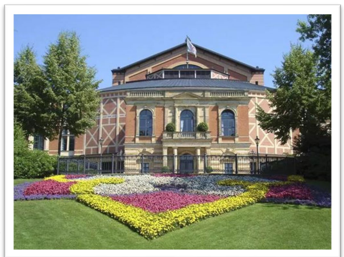
圖四：拜羅伊特節日劇院今日的樣貌。