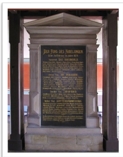
圖三：拜羅伊特節日劇院前的紀念碑，上頭標註歌劇尼貝龍根指環四部曲：萊茵的黃金、女武神、齊格菲、諸神的黃昏。