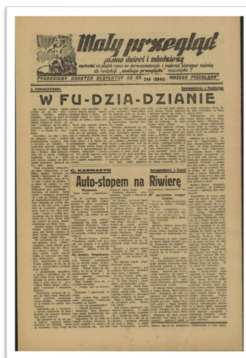
圖三：1939 年 9 月 1 日最後一期「Mały Przegląd」(小觀點)之首頁。

1926 年柯札克創辦的全國性、由成人主編兒童撰稿的兒童週刊《Mały Przegląd》(小觀點，圖三) 12 廣受歡迎。他所主持的兩個以兒童教育為主題的電台廣播節目（1934-1938）同樣備受喜愛，以至出版社將其內容以文字出版。 13 由於反猶運動，節目曾經中斷。之後在聽眾要求下復播。二戰爆發再度停播。柯札克參與合作過不少雜誌如《Głos 聲音》、《Przegląd Społeczny 社會觀點》、《Wiedza 知識》，或兒童雜誌如《Promyk 一小道光》、