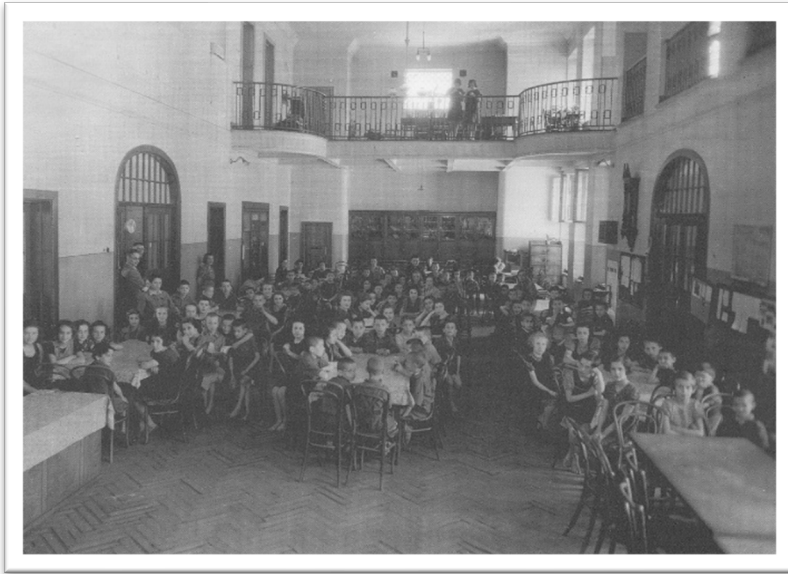
圖二：「孤兒之家」院童合照，1940年。

瞭解到更多有關貧困孩童的處境與心靈活動。 4 他將見聞以「悲慘的華沙」（法文：La Misère de Varsovie. 1900年）為題發表了看法。同時也發表了以「孩童與教育」（法文：Enfants et éducation. 1900年）為題的一組七篇文章。 5 也是1900這一年，柯札克加入一個以接待貧苦孩童為主要對象的夏令營協會 6 ，且於1904、1907、1908年擔任帶隊老師。夏令營帶給柯札克許多寶貴經驗，他都仔細做了記錄為後來者提供參考。