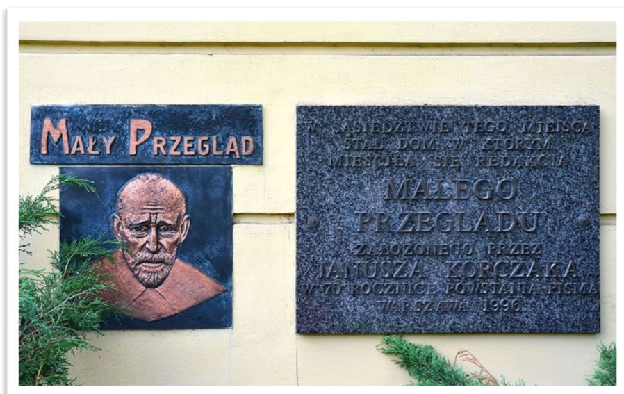
圖五：Pałacu Mostowskich 宮殿（現今華沙警察總部所在地）牆上紀念柯札克創辦「Mały Przegląd」（小觀點）之牌匾。

—2004 年聯合國教科文組織與波蘭華沙 Maria Grzegorzewska 大學簽訂協議在該校成立 UNESCO Janusz Korczak 講座。