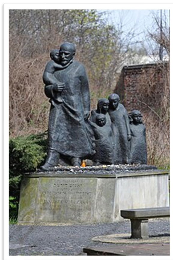
圖六：位於華沙猶太公墓的柯札克紀念碑。