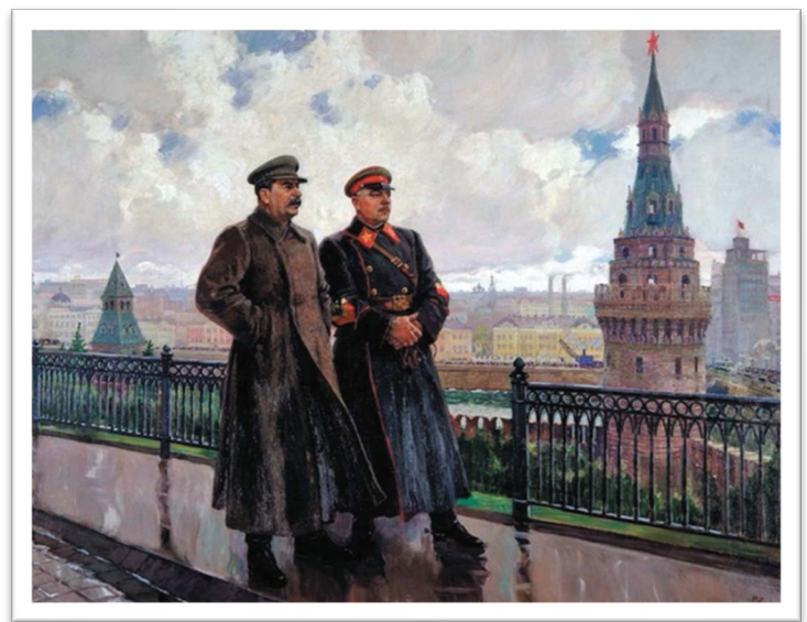
圖五：《史達林與伏羅希洛夫在克里姆林宮》現藏於特列季科夫畫廊（Tretyakov Gallery）。