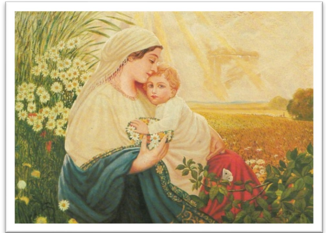
圖一：希特勒繪於 1913 年的《聖母與聖子》（Mother Mary with the Holy Child Jesus Christ）。

希特勒從小便立志成為畫家，不惜違背父親希望他當公務員的意願。十八歲時（1907），他首次報考維也納美術學院（Academy of Fine Arts Vienna）失利，隔年再嘗試仍被拒之門外。因為在希特勒提供的作品集中，評審認為在人像繪畫上的技巧不足，在建築方面比較有天賦。評審鼓勵他轉報考建築學校，但對於沒有中學文憑的希特勒來說根本毫無希望。在