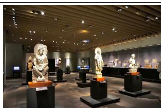
2. 東京國立博物館東洋館內亞洲文物

東京國立博物館是日本規模最大、歷史最為悠久的博物館，其歷史可追溯至 1872 年。今年是東京國立博物館迎來其創立 150 周年，推出「東京國立博物館國寶大集結」特展，館藏 89 件國寶全數傾囊而出，展出日本室町時代的〈秋冬山水圖〉、安土桃山時代的〈檜圖屏風〉、〈松林圖屏風〉、6 世紀古墳時代的埴輪武