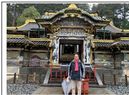
1. 日光東照宮唐門前留影