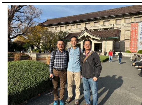
1. 東京國立博物館前合影