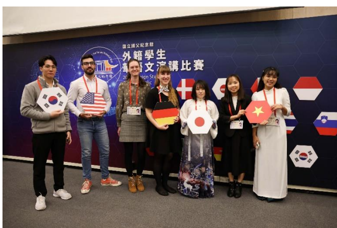
現場設計手持的國旗，讓參賽者自由取用拍照合影留念。