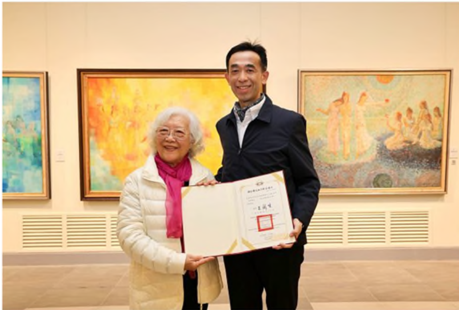
【台灣電報記者玉女／台北報導】

ⓐ 5 天 ago 玉女 ( https://enn.tw/?author=6 )