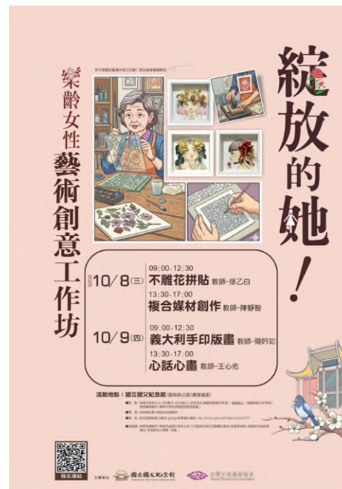
▲光復南路入口海報