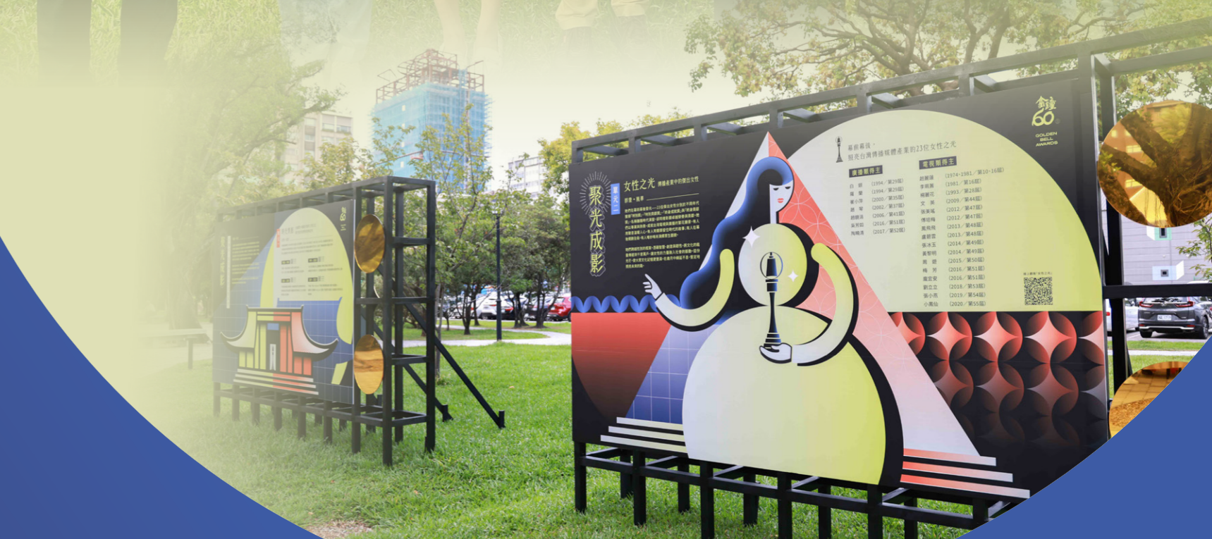
「聚光成影：金鐘60」線上展覽藝術裝置設置於中山文化園區