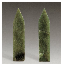
圖版4：西漢時期玉圭