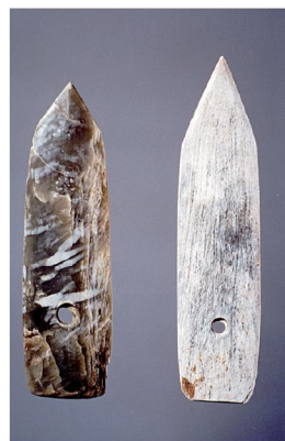
圖版1：卑南遺址圭形矛鏃