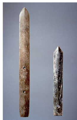
圖版2：卑南遺址圭形玉器