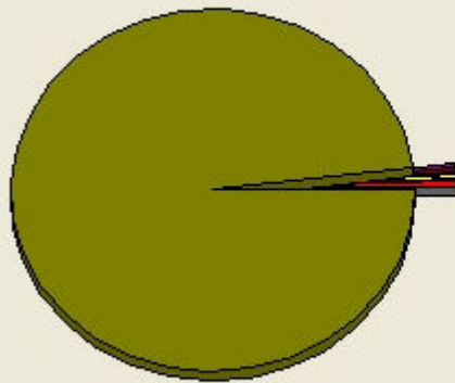
102年05月資產科目金額比例圖