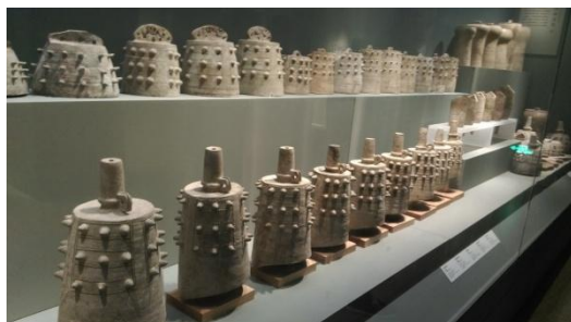
出席代表參觀南京博物院 (2014/10/31)

與會代表於參訪中山陵之後，當日下午則轉往南京博物院參觀。依南京博物院簡介說明，南京博物院坐落於南京市紫金山南邊，占地約 7 萬多平方公尺，是中國大陸第一座由國家投資興建的大型綜合類博物館。據統計，南京博物院藏品有 42 萬餘件，從舊石器時代所發掘的考古文物，到當代藝術作品均有收藏，有全國性的，也有地區性的；有宮廷文物，也有民間社會所徵集或捐贈之藝術品。所收藏的品項計有青銅、玉石、陶瓷、金銀器皿、竹木牙角、漆器、絲織刺繡、書畫、印璽、碑刻造像文物等。種類繁多，藏品豐富，參觀南京博物院這些歷朝歷代的歷史文物，好似見證人類文明的發展史，頗有可看性，值得細細品味慢慢欣賞，整個參訪行程於下午結束。