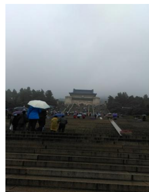
出席代表拜謁中山陵 (2014//10/31)

內幾乎沒有實牆，而是用竹子、荷葉等植物造景來作阻隔，由於用光影效果，使得館內視覺通透、很具空間感，讓參觀者進入館內有心曠神怡舒適感；館內主要展出六朝時期(距今約千年)的瓷器 and 陶俑等珍貴文物，是中國大陸第一個以『六朝』(東吳、東晉、宋、齊、梁、陳)為主題的博物館 2 。此博物館不管是在展件之擺放、光影效果之製作及參觀動線之規劃上，均屬一流，頗值博物館界學習。