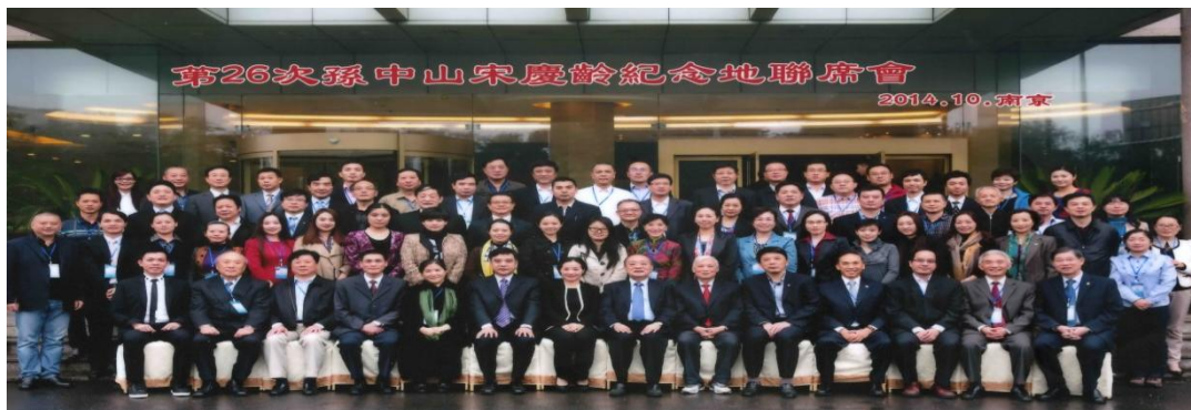
第 26 次孫中山宋慶齡紀念地聯席會議出席代表合影 (2014/10/31)

隨著參訪行程的結束，「第 26 次孫中山宋慶齡紀念地聯席會議」也劃下句點。大部分與會代表於第二天(11 月 1 日)上午返程離開，本館人員也於該日上午離開南京赴祿口機場，搭機返回台北，完成參加孫宋紀念地聯席之任務。