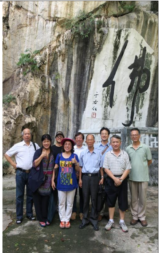
霹靂洞內藏有書法家于右任的題字及國畫大師張大千的字畫