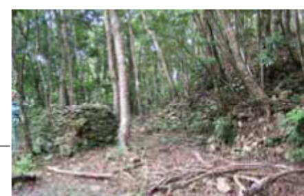
浸水營古道上清營盤遺址