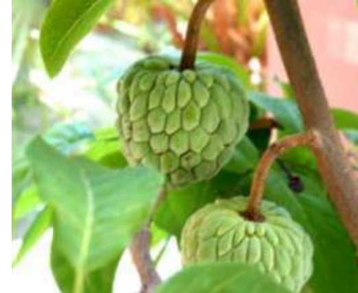
展廳外由台東農業改良場提供的釋迦樹

接續的貳部曲「六十七采風行-釋迦果之旅」是與行政院農委會臺東農改場合作，藉由展覽中與釋迦果相關的歷史記錄連結當今臺東的地方產業，在臺東農改場的協助下，不但在展期間提供不同品種的釋迦果樹於展廳外供觀展民眾認識與觀賞，也在貳部曲的戶外活動中帶領參與者至釋迦果園與產銷班實地了解產業現況。