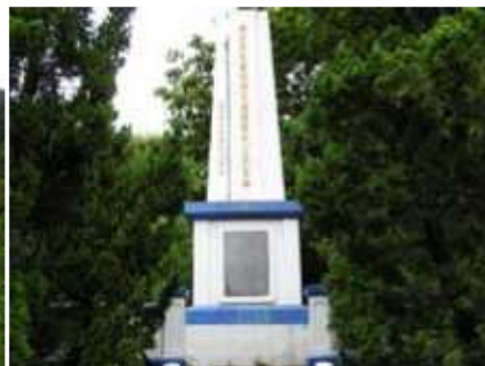
位於台東市鯉魚山下的胡傳紀念碑及碑文