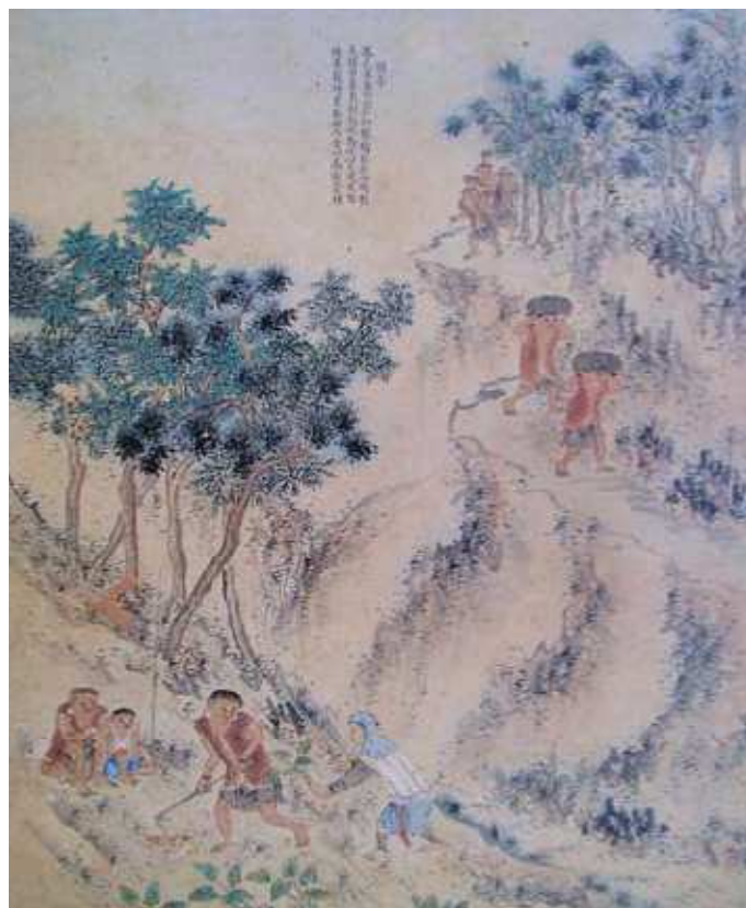
中央圖書館臺灣分館所藏《番社采風圖》中描繪鳳山縣內山原住民的「種芋」情景