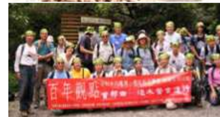
首部曲「踏上通往後山的百年足跡—浸水營古道」營隊