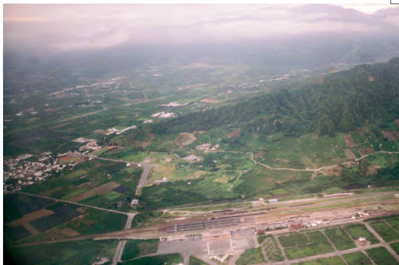
圖二 卑南遺址及卑南文化公園空中鳥瞰-1998年3月

不過基於一些現實考量，都市計畫用地變更及土地取得之配合程序一開始並未按此理想進行。80年4月史前館籌備處委託益鼎工程公司規劃完成之史前館建築計畫，其基地範圍僅包含都市計畫公園用地18.16公頃，以及甫變更都市計畫之保護區11.32公頃，合計29.48公頃。遺址其他部分則劃入都市計畫農業區，以及非都市土地山坡地保育區。逐步進入實質建設之階段後，一個重大問題慢慢浮現：一級古蹟上是否適合興建大型建築？此外，基地內可能有主要斷層經過，亦是值得憂慮之處。80年12月的籌備處規劃委員會議中，決議史前館主體建築必須另覓基地興建。