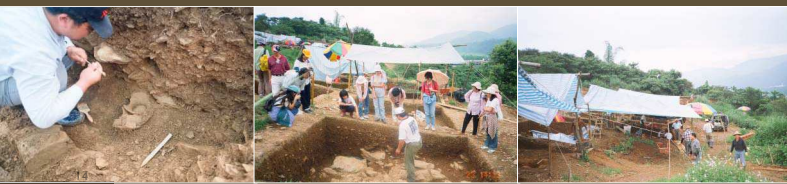
在田野裡看學長清理樣本是一種享受！