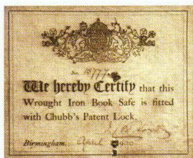
檳榔嶼同盟會可能用此鐵制保險箱來存放現款和文件。它是在1900年在英國伯明翰製造，可防火，裝有家室專利鎖(Chubb's patent lock)。

這裡不僅保留同盟會時期，檳榔嶼同盟會員存放現款和文件的鐵製保險箱，電影《夜·明》電影中「庇能會議」的場景，也在此地拍攝。我們一行人在此除考察有關孫中山和檳城支持者的歷史與事蹟