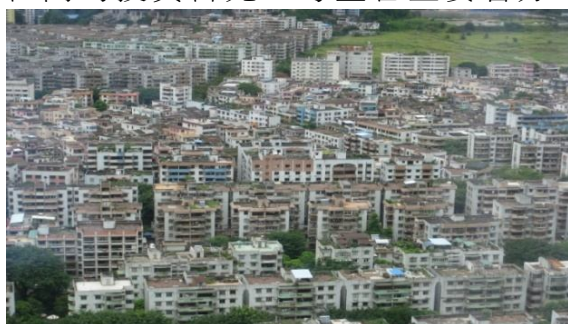
廣東省中山市市景鳥瞰(102/07/24)

隨著中國大陸改革開放，近年經濟快速發展，各地方政府為持續推動經濟成長，紛紛舉辦經貿、文化或觀光等相關論壇，以爭取中央政府挹注資源，吸引台商的投資目光。考量各主要省分均有代表性的「論壇」，尤其緊鄰廣東的福建廈門已有代表性的「海峽兩岸經貿論壇」，廣東是中國大陸最早對外開放的省分，經濟實力在中國大陸各省