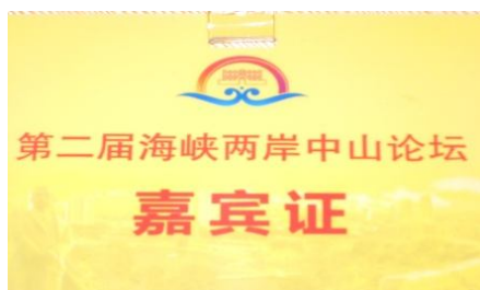
附錄三：中山論壇嘉賓證