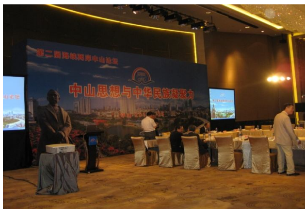
中山學術論壇會場(102/07/24)

在孫學研究議題上，透過學術論壇，讓兩岸學者闡述中山思想的演繹與發展，檢視兩岸對國父所創建三民主義的實踐成果，如以闡述三民主義為例，大陸學者普遍關注民族及民生主義，少談民權主義，而臺灣學者則以民族、民權及民生主義三個主義相互依存不可偏廢，