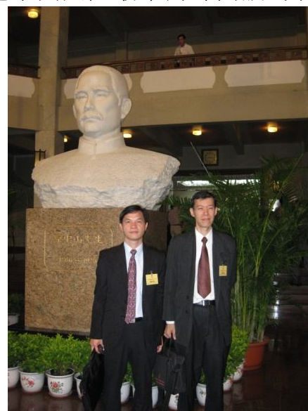
本館人員在中山市中山紀念堂留影 (102/07/24)

孫中山先生是中華民國的創建者並尊為我們的國父，中國大陸則稱孫中山先生為革命先行者，海峽兩岸對一致尊崇孫中山先生，因此，中國大陸舉辦以孫中