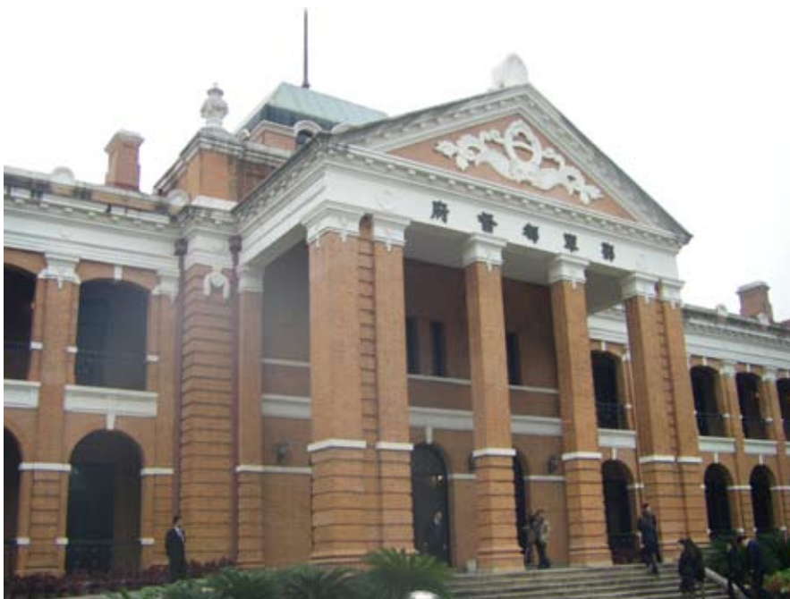
辛亥革命武昌起義紀念館館舍正門

辛亥革命武昌起義紀念館位於武漢市武昌閱馬廠，西鄰黃鶴樓，南面首義廣場。舊址大門前矗立民國時期鑄造的孫中山銅像。舊址原為清政府設立的湖北諮議局局址，1910年（清宣統二年）建成。1911年（辛亥年）10月10日，湖北革命黨