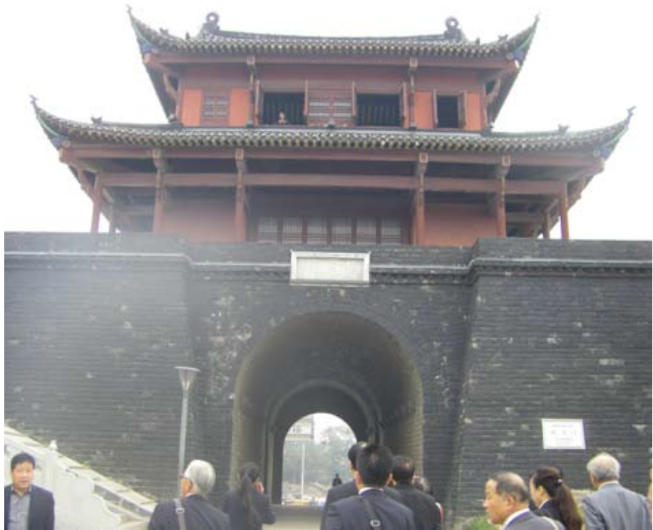
與會成員參訪武昌起義首義門

起義門是辛亥革命的見證，原是武昌古城的中和門，始建於明朝洪武年間（1368），距今約700多年歷史。1911年10月10日，湖北新軍工程營起義後，迅速控制中和門，南湖馬炮營得以從此門入城，在城頭架炮轟擊湖廣總督府，掀