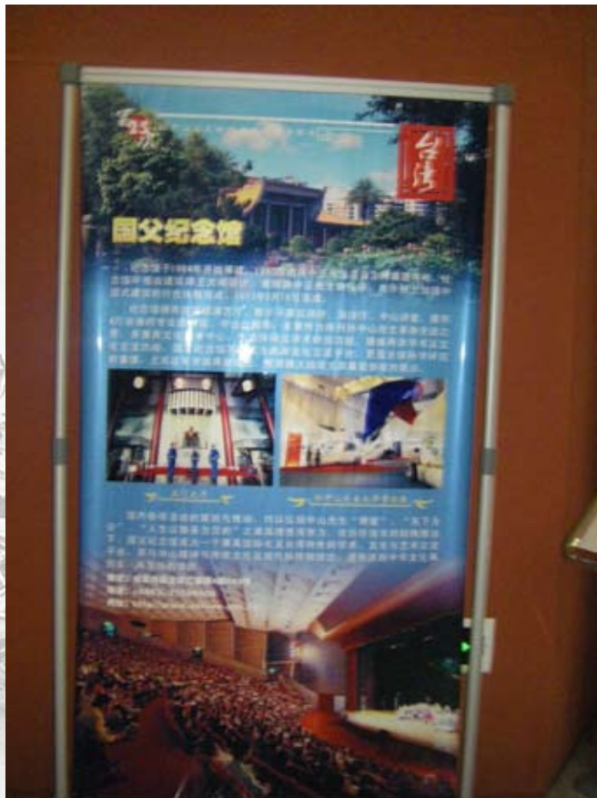
本次聯席會標示之本館場景介紹