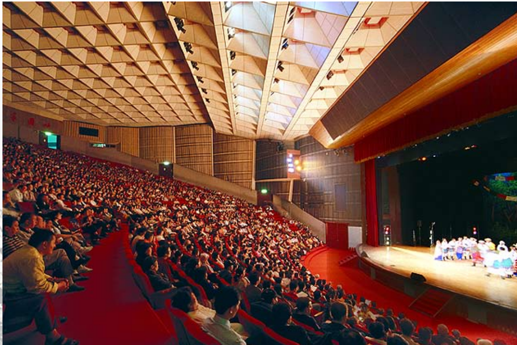
四、大會堂表演情形