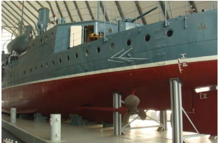
中山艦博物館館內展示已修復之中山艦艦體

中山艦原名永豐艦，它是以孫中山先生的名字命名的一代艦。1910年由清政府向日本訂購，1912年建成下水，1913年加入中國海軍。1922年孫中山「廣州蒙難」時，登臨該艦指揮平叛。1925年孫中山去世，為紀念他而改名為中山艦。1938年「武漢會戰」中於長江金口水域被日機炸沉。1997年被打撈出水，2001年修復保護工程竣工。2006年舉行中山艦博物館奠基儀式。2009年中山艦博物館園區建設竣工。 6