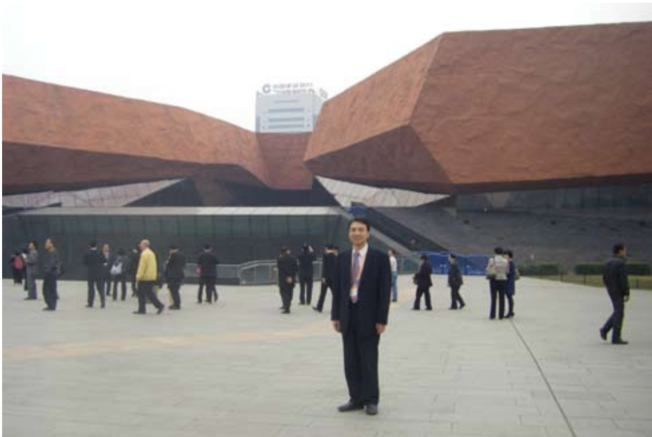
辛亥革命博物館及其廣場之場景

辛亥革命武昌起義紀念館，另一稱號為「紅樓」。2011年大陸當局令於紅樓前方建築一「辛亥革命博物館新館」，有時直接稱呼為「辛亥革命博物館」，轄區面積廣大，2011年10月10日建成開放，館舍展覽中國近代史之過成。 4 陳展聲光影象具備，並請多位近代史專家學者為其展出內容把關，為少數專業陳列歷史過程之博物館。