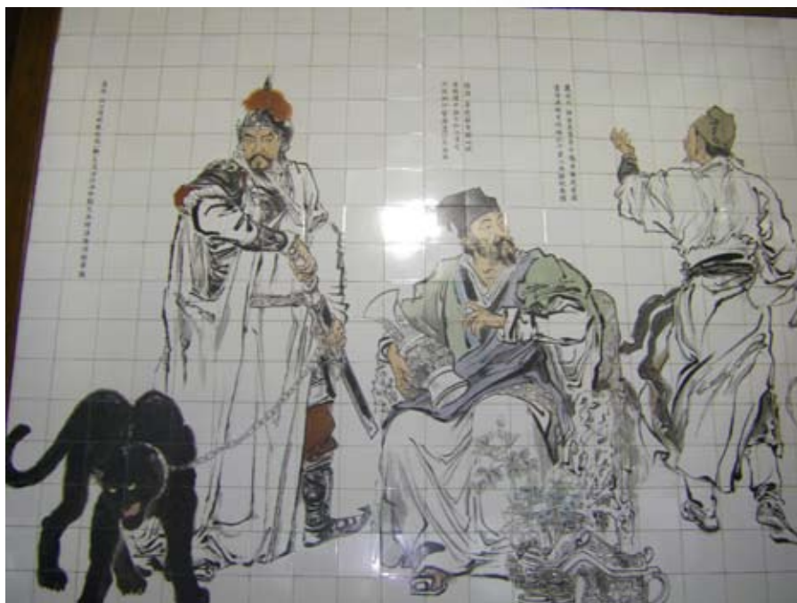
本次活動參訪黃鶴樓場景之二—歷史上愛國詩人和民族英雄之牆面磁磚