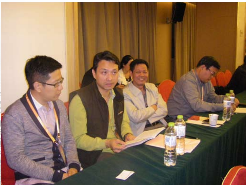
聯席會議之會前準備會議會場一景