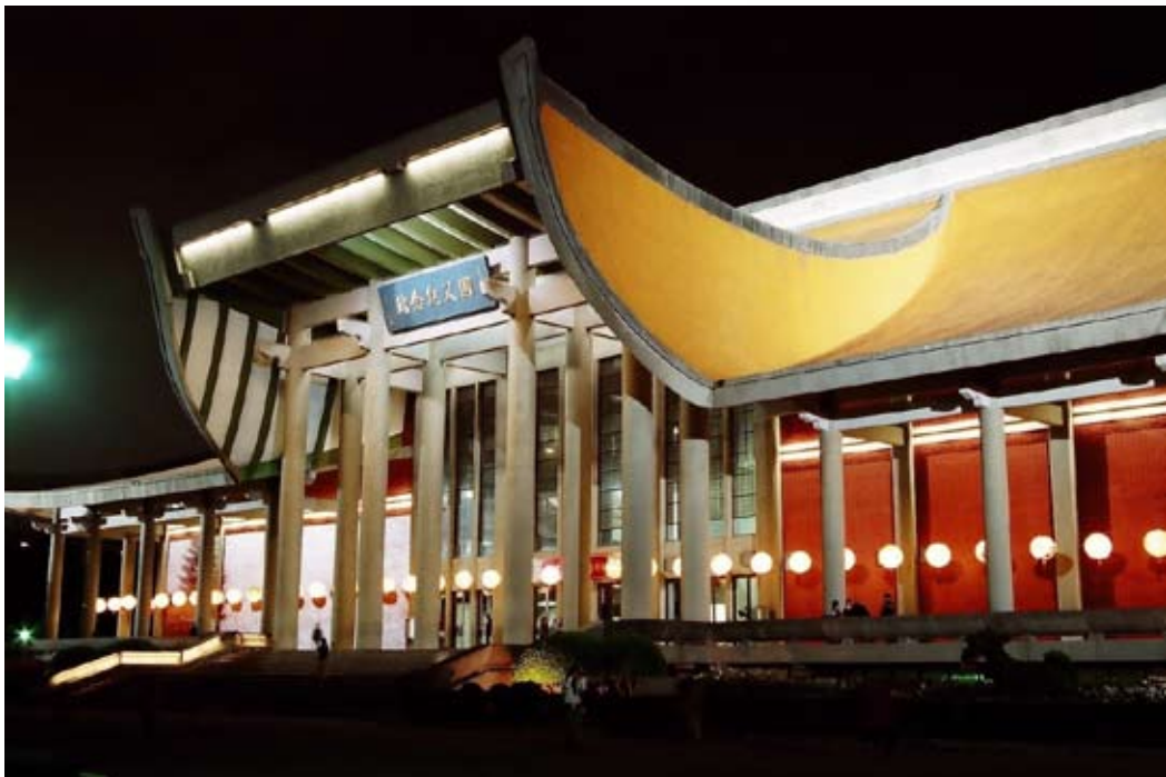
二、國父紀念館夜景