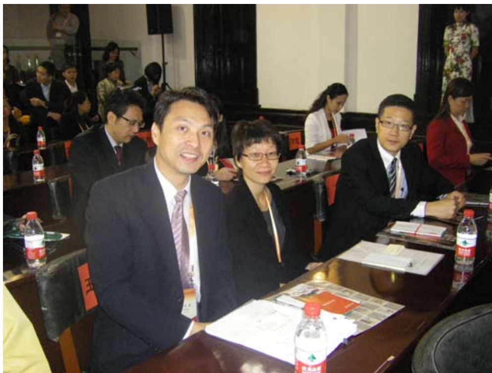
前排由左至右為本館與香港、澳門代表合影