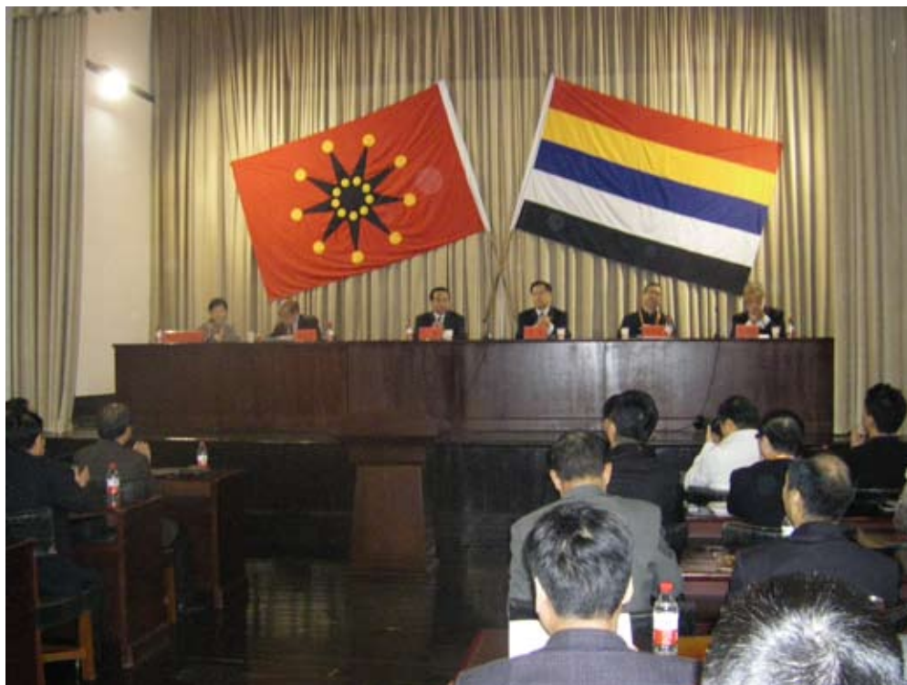
本次會議於辛亥革命武昌起義紀念館館內舉行（會堂後之旗幟為其既有之裝置，為同盟會時各種不同之主張）