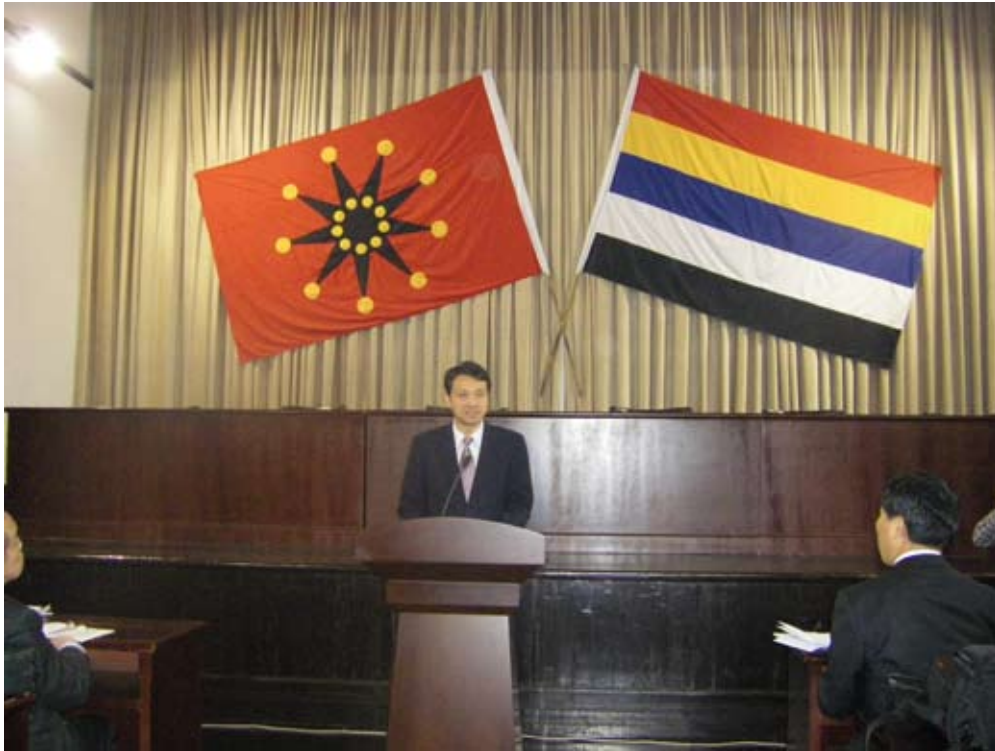
本館代表於會議中致詞並介紹本館成果