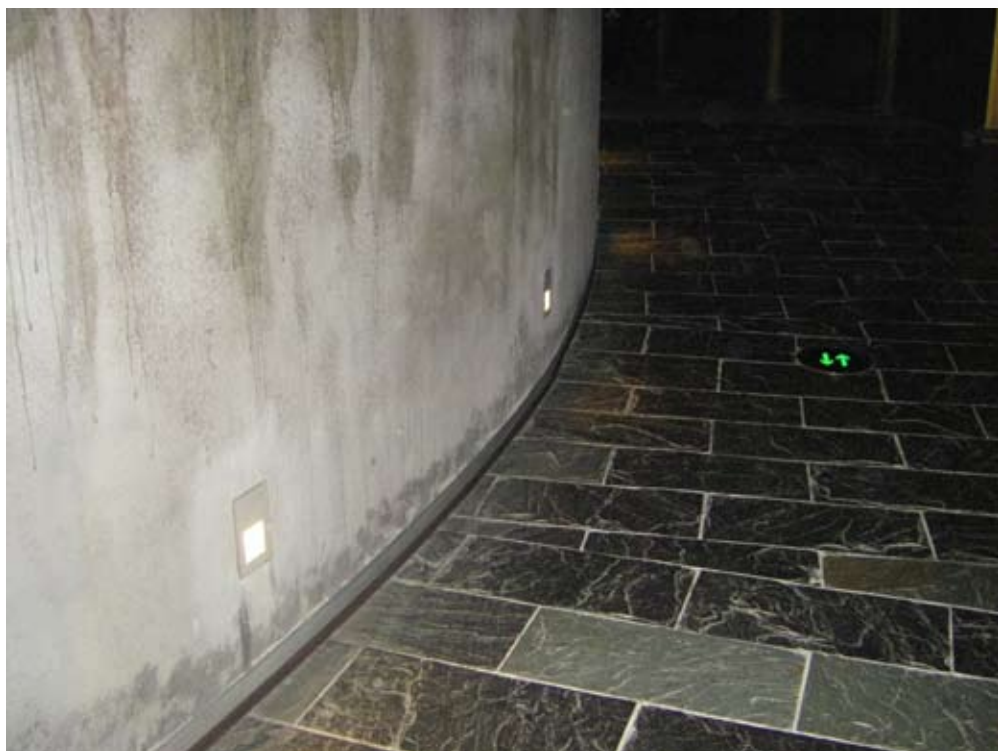
辛亥革命博物館展示區之地上燈光指示