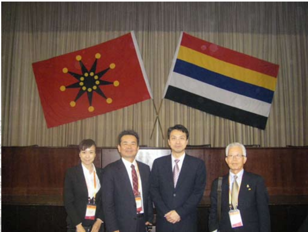
本館代表於會議後與日本友館合影