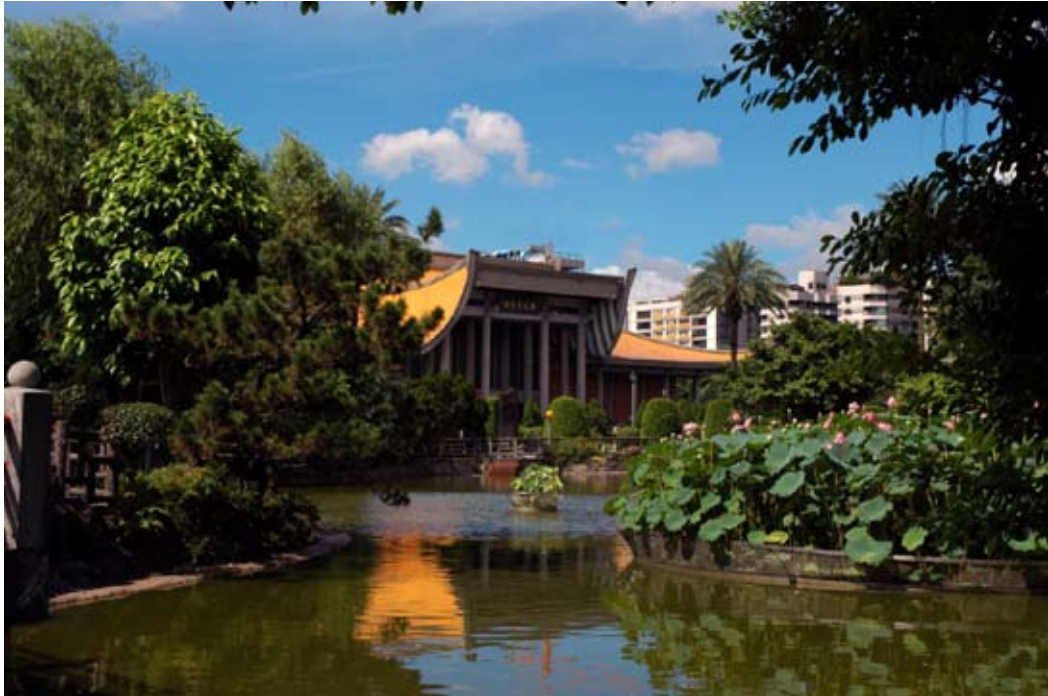
一、國父紀念館翠湖一瞥