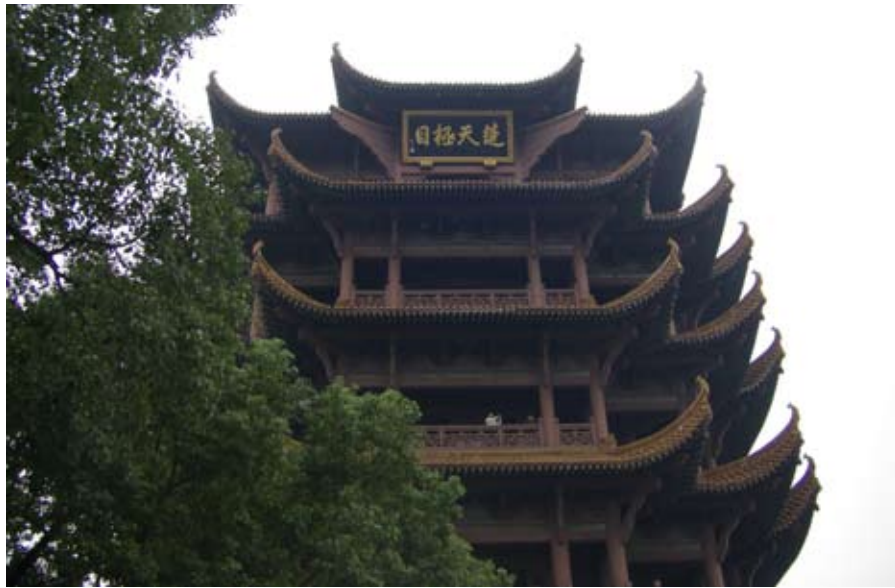
本次活動參訪黃鶴樓場景之一

黃鶴樓位於武漢市武昌蛇山上，是江南四大名樓之一。黃鶴樓高約50.4公尺，始建於三國時代（223），歷代屢修屢毀，明清兩代被毀7次，重建和維修了10次，有「國運昌則樓盛」之說，現在的建築為1985年重修的。 5