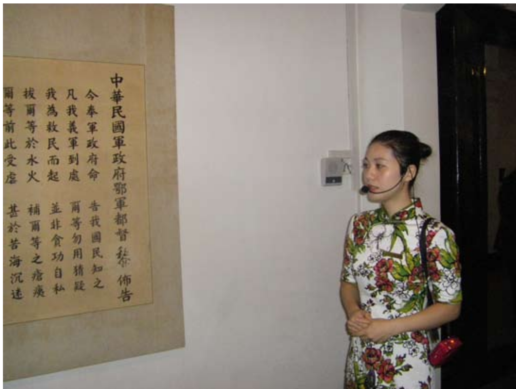
辛亥革命武昌起義紀念館解說人員導覽情境