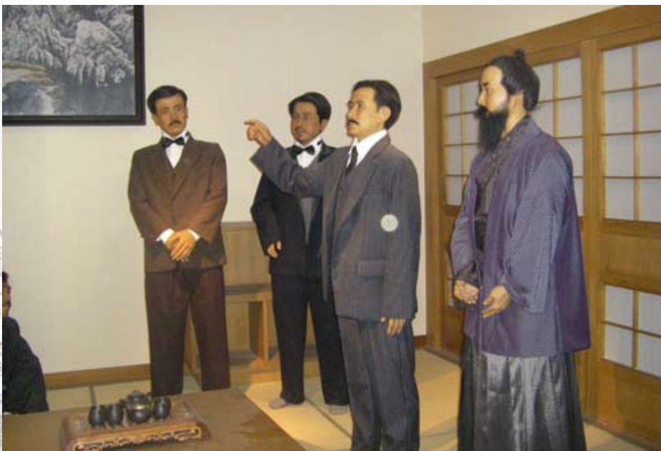
辛亥革命博物館以生動之蠟像方式展示國父革命過程