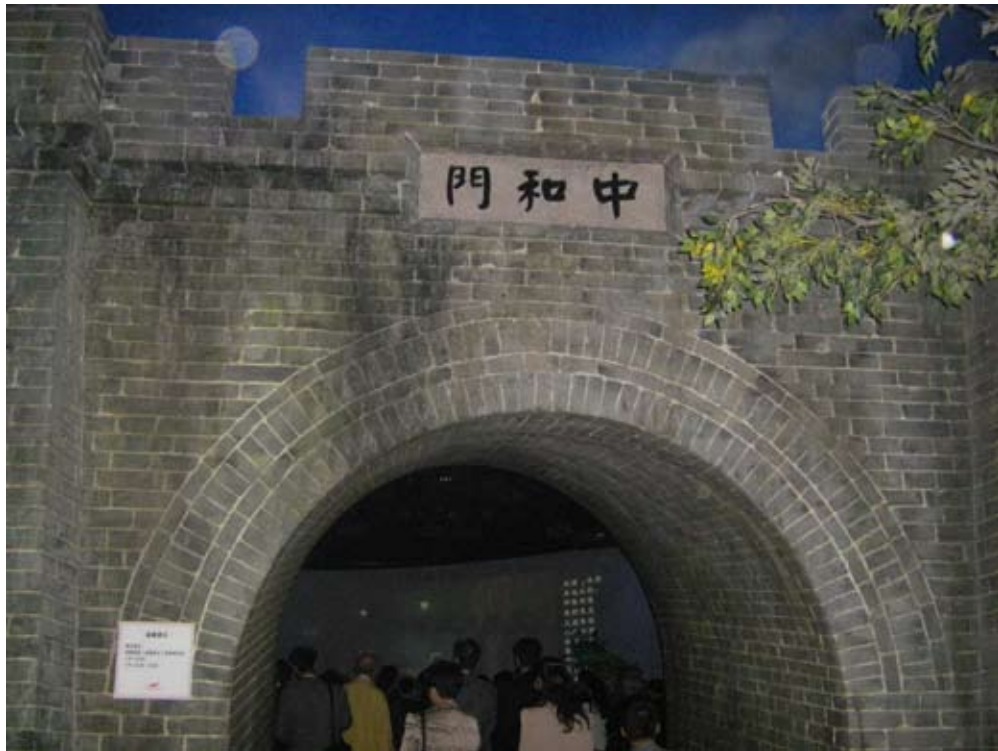
辛亥革命博物館展示辛亥革命情境