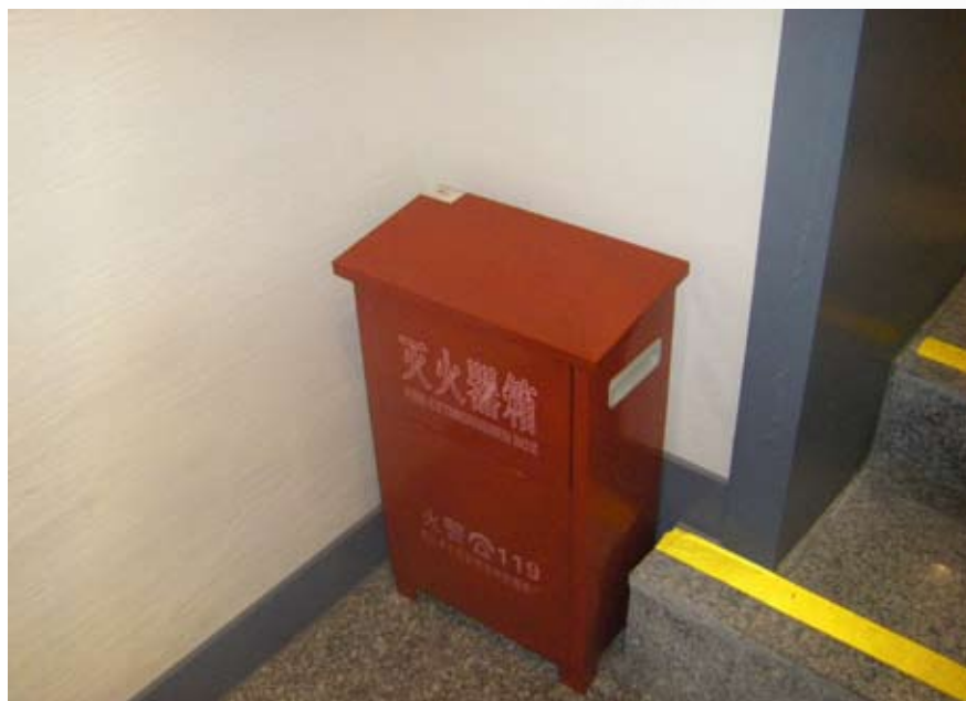
辛亥革命武昌起義紀念館館內公共安全措施之一

人成功發動了武昌起義，組建中華民國軍政府鄂軍都督府，義聲所播，全國響應，兩千餘年的君主專制結束，亞洲第一個民主共和國成立。武昌因此被譽為「首義之區」，武昌起義軍政府舊址也被尊稱為「民國之門」。 1