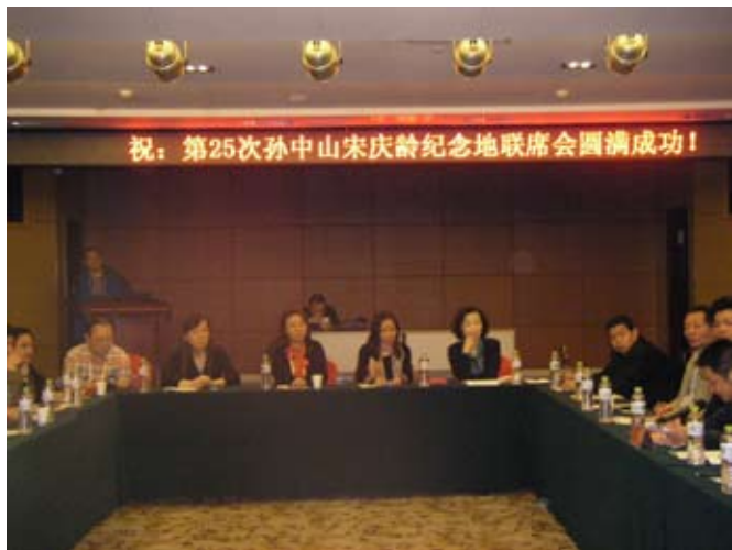
聯席會議之會前準備會議會場一景

10月16日20：00~21：30抵達武漢報到後，主辦當局馬上召開聯席會議之會前準備會議，會中作成明（103）年本聯席會由南京中國近代史遺址博物館主辦之決議。