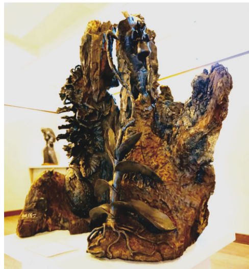
首度公開展出的珍貴類木化石雕刻-生機無限

五月新展覽上檔，希望藝廊瀟灑一股醇厚的木質香氣，上好的檜木、櫟木與芳樟，彷彿濃縮了整座森林的氣息，吸引參觀者一探。