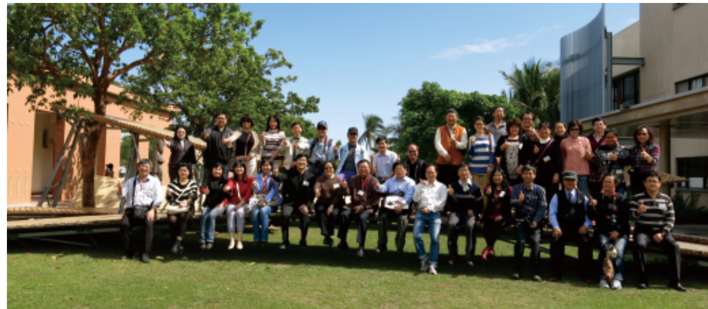
東區基地行政人員講習

這寧靜的革命，為了生活的可以像生活。此計畫，無關貧窮富貴，只關它是否可以在不知不覺中，符合美的原理原則。讓學習過的孩子，可以有辨識美及鑑賞美的能力，進而與它合而為一，享受它的美好。如同飲一口茶：由好茶、好水、好壺、好杯、好人、好環境而組成。這當中關係到感性與理性的完美契合，而我們現在可以做的是以當下的資源與智慧，賦予下一代生活美感的能力。