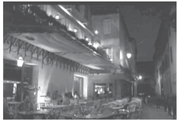
阿爾的夜間露天咖啡座

說起普羅旺斯，因為塞尚（Cézanne）而知名，它那地中海的乾燥氣候與明朗的陽光溫暖的季節，不僅僅是北方的人們度假的聖地，更是許多藝術家在晚年前來定居的藝術天堂。二十世紀的藝術大師馬蒂斯、畢卡索，還有回到故鄉普羅旺斯的塞尚，都在這裡找到他們繪畫的謬思。而梵谷也在這兒畫下他的《金黃麥田》、《向日葵》、《鳶尾花》，還有他的《絲柏》和令人印象深刻的《星夜》。普羅旺斯的天空下，藝術家的感受靈敏，普羅旺斯的陽光也曾給予印象派畫家雷諾瓦（Renoir）與席涅克（Signac）創作的靈感，巴黎之外，似乎就屬這一片南方的天堂，能夠給予藝術家阿卡迪亞（Arcadia）般的吸引力。