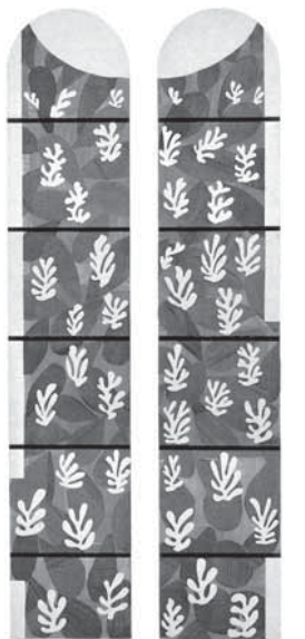
馬諦斯 為文斯禮拜堂所作的生命之樹 515x252cm 剪紙 1949 梵蒂岡美術館

馬諦斯 (Henri Matisse, 1869-1954) 是眾所周知巴黎野獸畫派 (Les Fauves) 的領袖，但這個短暫的報派「畫派」其實只有短短一二年的活動，就各自發展了，但色彩的野獸一旦逸出藩籬，現代繪畫就不可收拾啦！馬諦斯的藝術豐富多采，並不止於青年時代勇猛的色彩革命，他也是線條的素描大師，以剪刀作畫造型的奇才，他還是品味優雅的現代藝術巨匠。