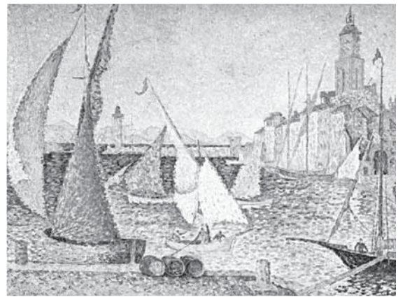
席涅克 聖托佩 油畫1897 阿諾西得美術館

看著普羅旺斯的真實影像穿插著畫家的圖像，明明知道真實的世界與畫家創作的作品是二回事，但真實的世界如此平凡，而畫作卻如此奇特，令人驚異！或是逐漸的，感到了真實世界散放的獨特魅力，因此給予畫家無窮的靈感，孕育出一件一件動人的作品；也許紀錄片所能給我們最好的，便是呈現那屬於當地的獨特魅力。這是一個值得看第二次的紀錄片系列。一個普羅旺斯地方的導演，藉著畫家的創作生涯，將他的故鄉之美呈現出來，或者說，藉著個人對故鄉的情感，傳達了他對於大師的崇敬之意。