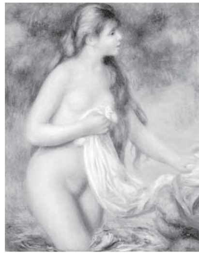
雷諾瓦 長髮浴女 油畫 1895 橘園美術館

影》 (Grande Illusion, 1937) 的大導演尚·雷諾瓦 (Jean Renoir) 的父親，2009年4月在台北市美術館舉辦的《世外桃源－龐畢度文化中心國立現代美術館收藏特展》中，展出的尚雷諾的影片《鄉村一日遊》 (Une partie de campagne, 1936)，還重現了雷諾瓦繪畫中的印象派情調呢。