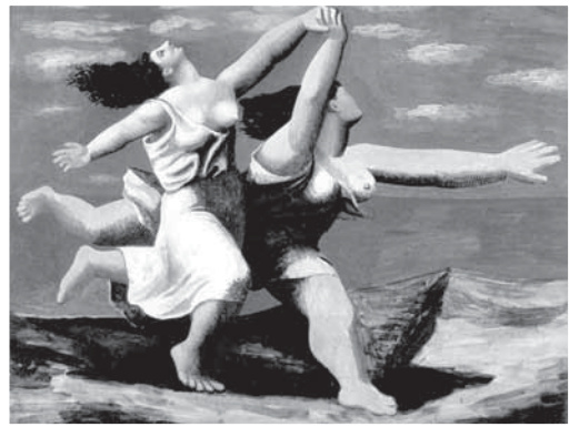
畢卡索 海灘上奔跑的女子 油畫 32.5x41cm 1922 巴黎畢卡索美術館

跟孩童一起奔跑嬉遊的老頑童。他是一個複雜的藝術家，他的藝術，充滿捷巧的知性，帶有都市的性格；而他的生命又如海灘上充沛的陽光，充滿熱力。普羅旺斯蔚藍天空下的畢卡索，從現代繪畫史的巨大形象跳脫出來，成了個享受陽光生活的活潑人物。天使、情人、孩童，山羊與貓頭鷹，甚至南法市集中的人物，全都穿上了戲服走入了他的畫中，蔚藍的天空、雪白的浪花、泥土的顏色，也鋪滿了他的畫面。