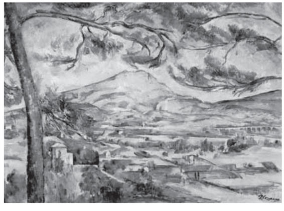
塞尚 大松樹與聖維克多山 油畫 66x90cm 約1887年 倫敦柯特藝術學院藝廊

形體塑造的更為堅實。簡化，是塞尚的原則，而分析元素再加以重組的畫面結構，卻讓它風景中的色彩更為豐富。