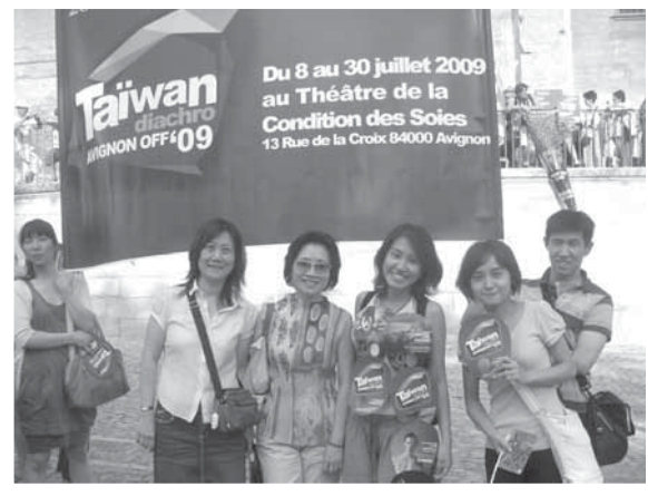
2009年外亞維儂藝術節教皇宮前廣場開幕，淡江大學實習生和帶隊老師合照。

本系95、96、97學年度下學期獲得教育部「學海築夢」計畫補助實施「外亞維儂藝術節劇場行銷計畫」。先後派遣11位碩士生赴法國亞維儂市（Avignon）的「走索人劇場」（Le théâtre Le Funambule）及「絲品劇院」（La Condition des Soies）進行為期1個月的劇場行銷實習。此實習不僅提昇學生法語口語表達能力，更增廣學生對於法國藝術文化環境的見聞，學生返台後撰寫實習心得報告，皆極為肯定此項學習活動。