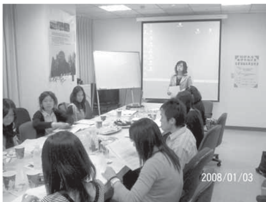
2008年碩士班學生讀書發表會

http://www2.tku.edu.tw/~tffx/web_cht/fredu/fredu-8.html