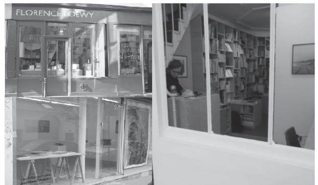
左上：佛羅倫斯·洛伊書店，左下：7號課書店，右：檔案室