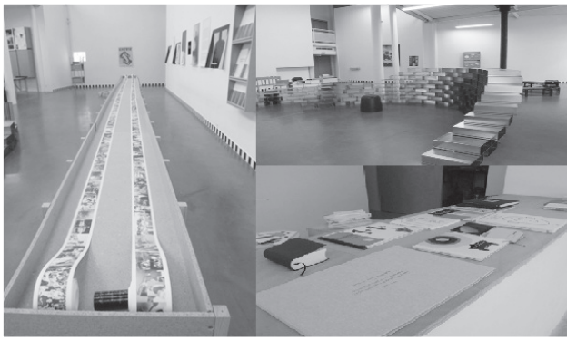
左：法國國立出版與藝術印刷中心，右：克里斯多夫·達維一德里的藝術家之書與出版社