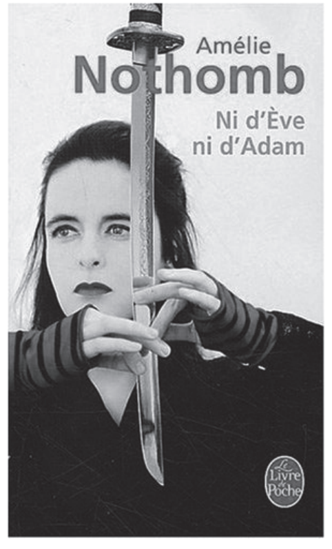
Ni d'Ève ni d'Adam

Roman de l'Académie Française) 外，也在2003年由Alain Corneau改編搬上電影螢幕，（中譯片名為《艾蜜莉的日本頭家》）由著名女星Sylvie Testud詮釋女主角，此片一出，賣座程度超乎預期，也吸引了更多觀眾回頭找出小說來閱讀，讓Amélie Nothomb的作品更炙手可熱。《Hygiène de l'assassin》也曾經改編為電影，只是沒有像《Stupeur et Tremblements》那麼引人注目罷了。