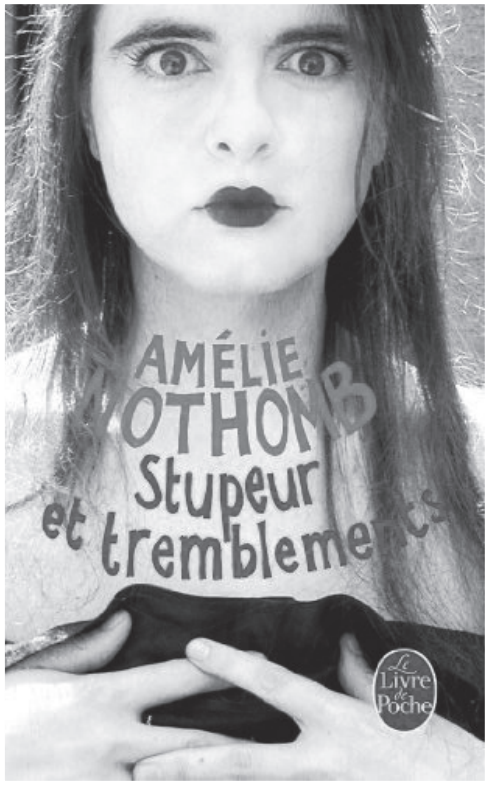
Stupeur et tremblements