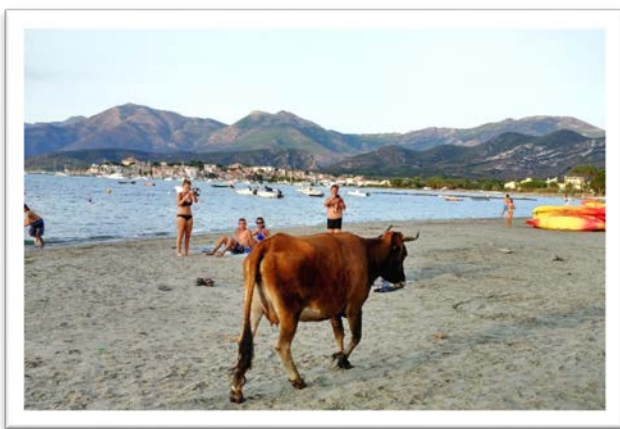
圖十一：母牛在海灘散步。

對於不太會游泳的我和大表姑來說，在海面上游走個 10 公尺遠還能踏得到海底，簡直是天堂，讓全身享受放鬆的片刻；甚至，因為其