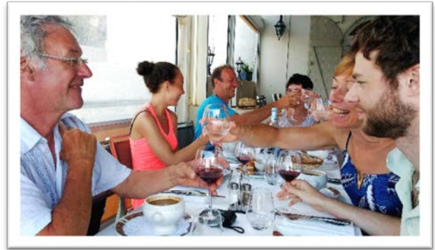
圖十：家人一起品嚐當地佳餚慶生。

我們在正午時分抵達濱海小鎮 Saint-Florent，來這裡美其名是逛有古典韻味的老城區與沙質海灘戲水、曬太陽，實際上是為了幫