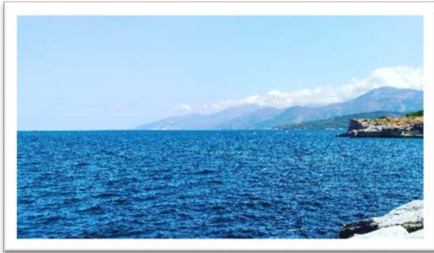
圖九：Saint-Florent 海濱層次分明的山巒。

因為耳聞北島利口酒的果香輕甜，室友也進一步詢問老闆是否有釀造桃金娘利口酒(liqueur de myrte)和檸檬利口酒(limoncello)，老闆眨個眼，立刻從身後冷凍庫拿出三瓶，現場開給大家品嚐，此刻我才知道原來利口酒最好都放冷凍以備不時之需。桃金娘果實(myrte)有如黑醋栗(cassis)，其利口酒色澤紅潤深邃、果香甜美濃郁；而表叔形容檸檬利口酒好似喝下黃檸香氣飽滿又清爽的檸檬磅蛋糕；第三種是以前角 Muscat 葡萄品種蒸餾的生命之水，酒精濃度高達 50%的利口酒，室友嚐完說道這真是自家釀才有的味道(圖八)。