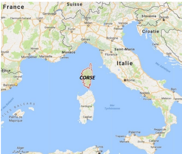
圖一：科西嘉島地理位置。

領了行李和早已線上預訂的租車，一行七人立即驅車前往民宿。民宿位於 Bastia 市中心偏至高點的住宅區，是一棟很有質感的在地人家。迎接我們的是一對比鄰而居、操著科西嘉口音的年輕姊妹，五官深邃、古銅亮麗膚色，個性爽朗樂天，這是與在地人的第一次接觸。開窗而見後院依山、前庭傍海，每天望向