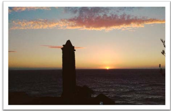
圖七：幽靜小徑上觀看日落。

由於這趟旅行的用意就是放鬆，所以我們每天都會找一處附近的海灘戲水、泡腳，遊北角的這天一直還沒有機會於午後下水，於是