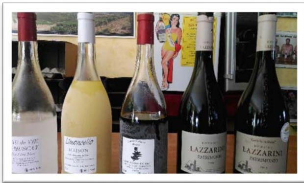
圖八：LAZZARINI 莊園自釀利口酒。

北角的山海景公路之旅，就在 Nonza 的海上夕照畫下句點，日暮低垂，夜幕漸起，天空由澄黃轉赤紅，再由赤紅轉粉紫之間的變化