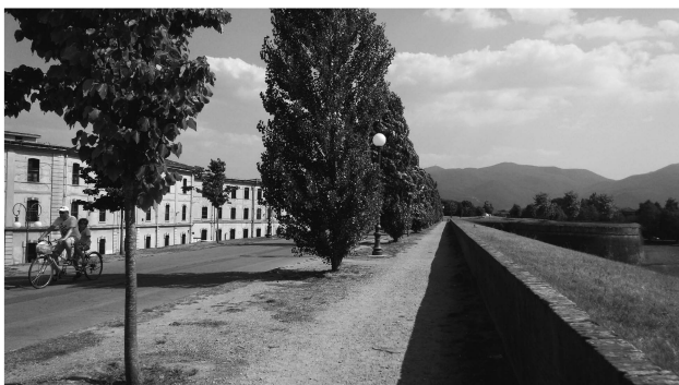
（圖六）遊客於城牆上騎腳踏車漫遊盧卡