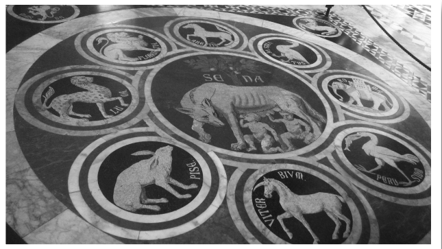
（圖一）西耶納大教堂地板上的母狼與雙胞胎圖

可惜的是，兄弟倆也逃不過父親與叔叔的命運，為了爭奪羅馬真正統治者的位置，羅慕路斯殺死了雷穆斯，而至此才是西耶納傳說故事的開始。命運的輪盤周而復始，Senius和Aschius兩兄弟為了逃離羅慕路斯的毒手，他們逃離羅馬，來到了罕無人跡的山上，建立了西耶納城。有一說法是西耶納（Siena）的名子來自於兩兄弟之一的Senius，也有人說是來自伊特魯里亞人的家族姓塞納（Saina），但真正的答案如今仍眾說紛紜。而兩兄弟也將母狼哺育雙胞胎兄弟的意象帶到這個城市，西耶納作為聯合國教科文組織認證的世界遺產，保留了自中世紀建城起的樣貌，因此現今也仍可在街上看到母狼和雙胞胎的圖案或雕像。（圖一）