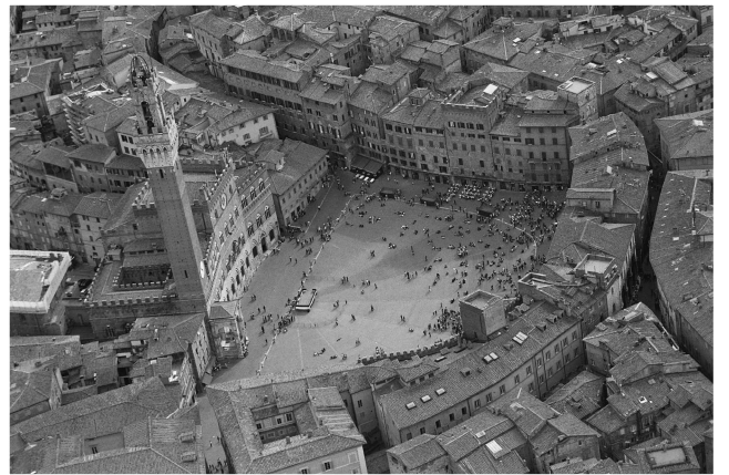
（圖三）西耶納廣場與人民宮