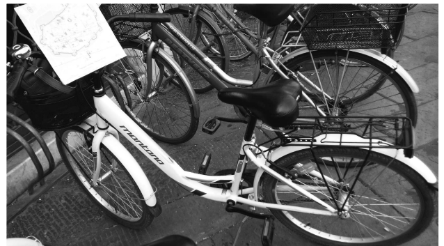
（圖五）盧卡觀光局提供租借的腳踏車