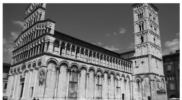
（圖七）聖馬蒂諾大教堂