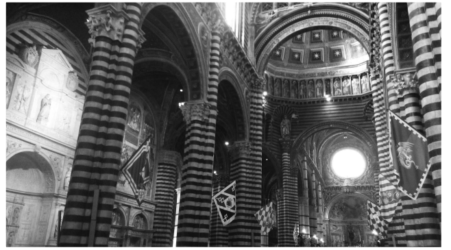
（圖二）西耶納主教座堂內部，柱子上裝飾著各區旗幟

西耶納賽馬節（Palio di Siena）於每年的7月2日和8月16日舉行，賽事前幾天起，一連串的遊行、初賽、練習等都是節慶的一部分，是西耶納市民每一年殷殷期盼的大慶典。競爭隊伍為西耶納市的各區住民，每一區會派出一名代表出賽，並有各自代表的顏色與旗幟。（因筆者造訪西耶納時正好為兩次賽馬節中間，只能看到街上裝飾的各區旗幟，如圖二。）由於人口遷移，今日的西耶納許多原戶籍居民並不居住在原區。不過，於賽馬節期間，居民都會紛紛返鄉，為自己所屬的隊伍加油。正因居民固守地區傳統，以自己故