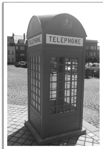
圖一：加萊市內的英式紅色電話亭。

七月盛夏，陰沉沉的天卻飄著雨，冷冽的風不停刮向我對難民營感到惴惴不安的心，當下確實想哭。然而經過一個月的相處，聽了當地人對難民營的想法與對加萊未來發展的想法，除了更加認識這塊土地，也對它產生了情感，更應證了接待家庭男主人時常掛在嘴邊的這句電影台詞—「人們來到北方會流淚兩次：一次是在抵達時，另一次則是在離開時」。