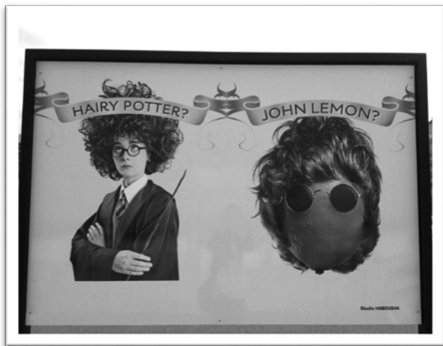
圖二：海岸邊廣告看板。

除此之外，加萊市長 Natacha Bouchart 更在今年 6 月發起「千人遊加萊」的活動，招待 1000 名英國民眾免費暢遊加萊一日，力圖向大眾宣示「叢林不再」，並展現「叢林」之後的加萊擁有美麗的海岸、城牆遺址，以及蕾絲博物館等多樣豐富的觀光景點(圖三)。