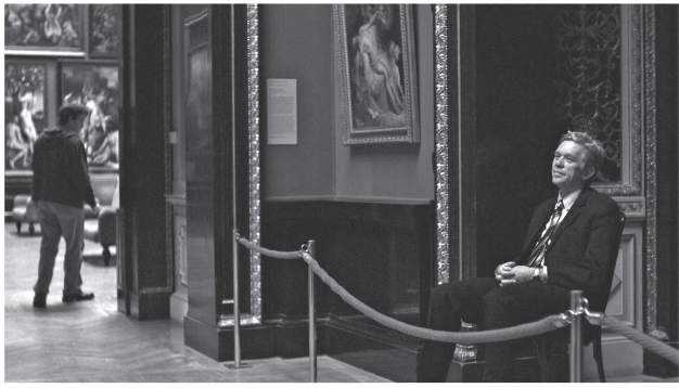
圖四：鮑比桑默飾演美術館的守衛。