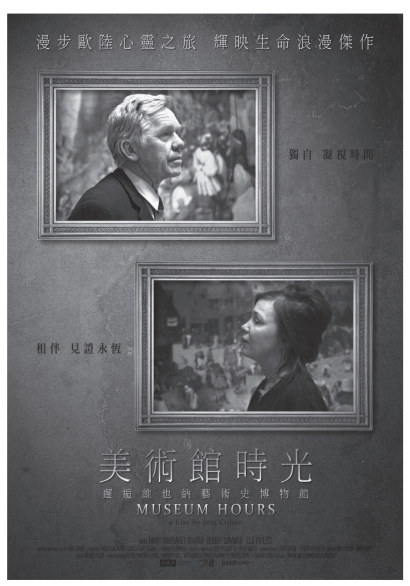
圖三：《美術館時光》電影海報

切換美術館與現實的雙重世界之間，色彩似乎是一個跨越異質事物的交集。電影開頭的第一個畫面——濃郁深沉的巨大紅色牆面，將和現實世界裡參差出現的紅色形成合聲。如約翰在街頭，公車與店舖前那大面積的塊狀紅色，和疾馳而過電車的紅色車體，一直到電影結尾時，約翰旁白的影片中，提到左側成排的車尾燈，那極美麗的閃爍光采，商店櫥窗內垂下的大片紅色布幕，和這部影片中某一個商店的招牌「Salzgrotte」字樣（忘了他們才剛剛遊了地底湖「Seegrotte」嗎？）。