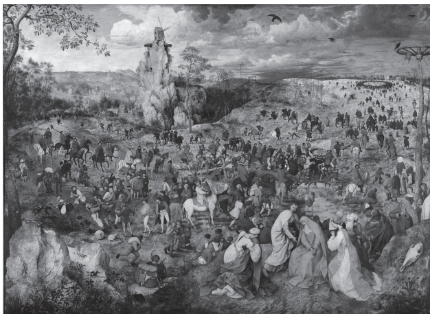
圖一：布魯哲爾描繪耶穌受難《前往髑髏地的行列》，1564，油畫，木板，124×170cm。

安遠從蒙特利爾來到維也納探望病倒的表妹，手頭不寬裕的她逛美術館打發時光，遇見約翰，兩人一起度過了走走看看這座城市的時光，直到表妹去世，各自回到生活的軌道。故事很淡，並無難解之處，只是味道淡的不易著落，如冬日裏在陌生城市中遊晃的中年女子的寂寞，也