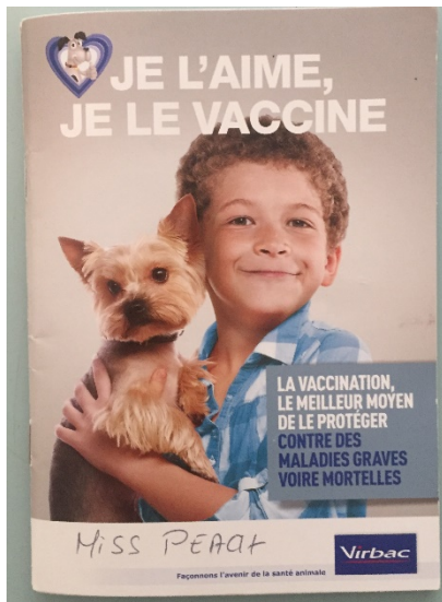
圖四：狗狗健康手冊。

法國人見面時，打招呼一定要先 bisou「親臉頰」，若是有養狗的家庭，也一定要跟狗狗 bisou 的。當聊天聊到愛犬的時候，大家更是滔滔不絕，津津樂道。狗狗就如同小孩，是一家人。有時會發現，在法國的狗，為什麼都很乖，遛狗時，不會莫名其妙暴衝，跟主人去餐廳吃飯時，狗狗也會乖乖趴在桌底下等主人用完餐，從來沒看過一隻狗狗是沒牽繩被放開而到處亂跑的，更沒有一隻狗狗會到處亂吼亂吠，會發現，狗狗是完全融入生活之中。狗狗在法國是寵物，也是朋友，其實可以說，狗狗跟人一樣，是生活中的主角。