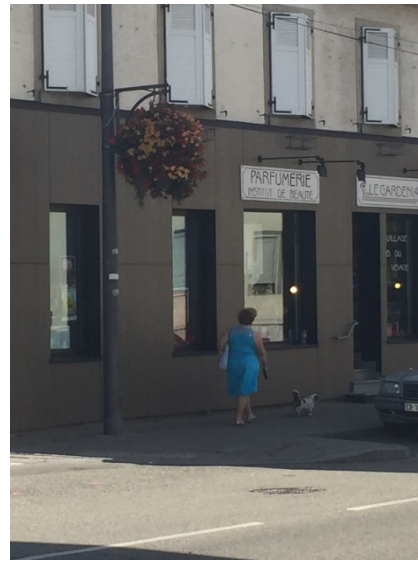
(左起)圖一、圖二、圖三：法國人帶著愛犬上街是稀鬆平常之事。