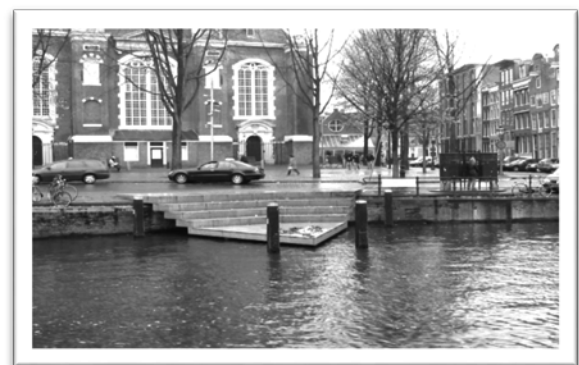
圖五：象徵「現今」的紀念碑接近運河水面，以階梯象徵現今同志漸漸浮上檯面。

除了在同同志驕傲週的運河大遊行，還有其他的活動如變裝皇后運動會 (Drag Olympics)、跨性別派對 (TransPride Party)、跨性別街頭遊行 (TransPride Walk)、露天 LGBT 主題電影放映 (Open Air Cinema)、荷蘭國家博物館同志主