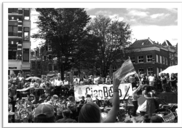
圖六：2017年8月5日大遊行當天盛況。

阿姆斯特丹同志驕傲週在活動資訊的可及性是相當高的。在活動前、活動中，COC Netherlands 把地圖及相關雜誌及文宣(圖七)擺放在若干同志酒吧、同志三溫暖等店家供民眾免費拿取。若有機會參加當地的同志驕傲週，可以順便欣賞這些雜誌及文宣品，除了