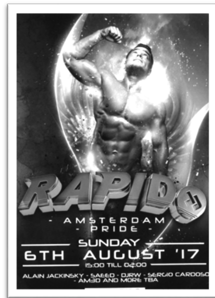
圖七：同志驕傲週店家文宣品。