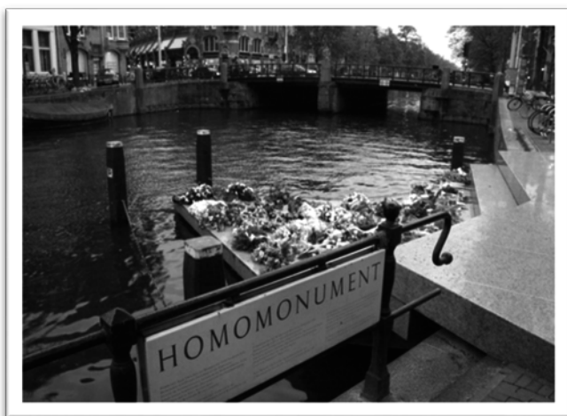
圖二：同志紀念碑前擺滿鮮花以哀悼受迫害的同志。

從此一年一度阿姆斯特丹同志驕傲遊行(LGBT Pride)的活動開幕式都在此舉辦，其附近也有設立同志旅遊諮詢服務台(Pink Point)，