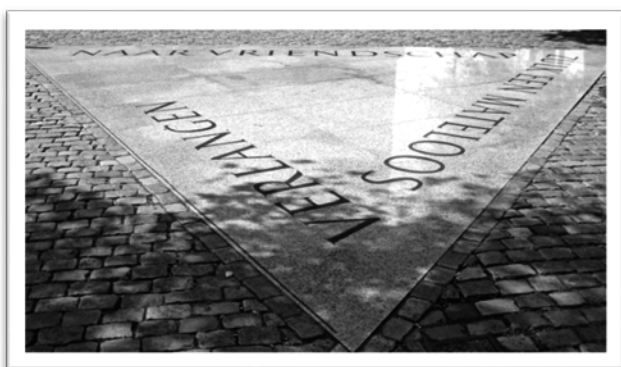
圖四：象徵「過去」紀念碑，篆刻荷蘭詩人 Jacob Israël de Haan 的詩句。

代表「過去」的碑是一塊嵌在安妮之家 (Anne Frank Huis 3 ) 旁邊廣場的三角形粉紅大理石，於其三個邊分別斷句篆刻荷蘭猶太籍詩人，亦為同性戀者 Jacob Israël de Haan(1881-1941)的詩「給釣魚少年」(Aan Een en Jongen Visscher, 1917)其中一句「如此遙不可及對友情的渴望」(Naar vriendschap zulk een mateloos verlangen)，象徵過去同性戀者無法勇於說出口的禁忌之愛(圖四)。又此小三角形紀念碑其中一個頂點指向同是集中營受難事件的安妮之家，象徵著過去受難者是不分種族、族群的。而象徵「現今」的紀念碑接近運河水面，以階梯象徵現今同志「漸漸浮出檯面」(圖五)，其頂點指向遠處水壩廣場的國家解放紀念碑，象徵同志族群與全荷蘭人站在同一陣線。而象徵「未來」的紀念碑是一座高 60 公分，突出地面的三角形，如同一個為同志設立的講台讓他們為自己的權益發聲，又其中一個頂點指向荷蘭同志平權運動協會 COC Netherlands 總部，象徵同志在未來不變的是，全民齊心陪伴同志族群，期盼將來能獲得「真正的」解放。