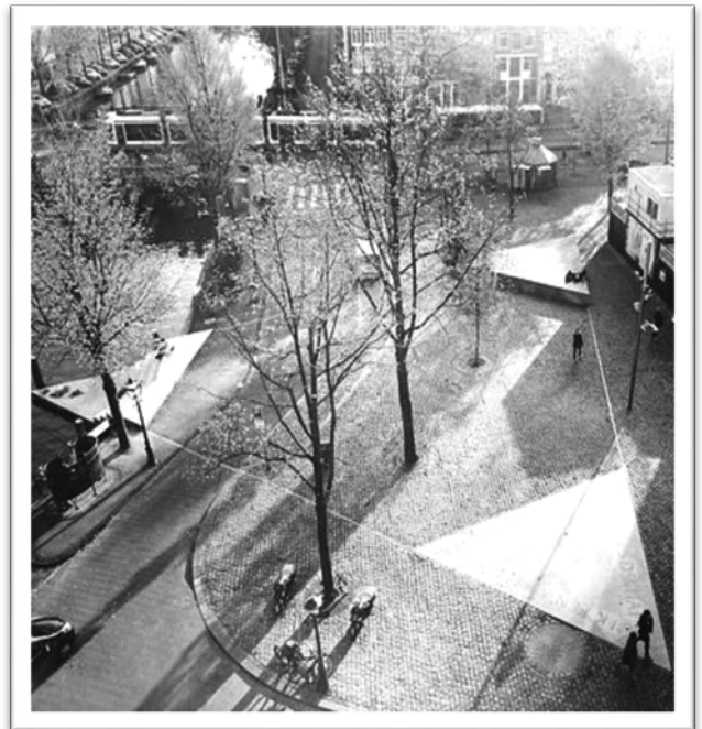
圖一：阿姆斯特丹同志紀念碑全貌。

同志族群都能在此「作自己」。而這些官方及民間相關機構協助同志族群，其創立宗旨為了讓同志能夠在主流社會，自由地去做他們想做的事、自由地去愛他們所愛的人，讓他們能夠在主流社會漸漸不被「另眼相看」。儘管荷蘭近幾年還是存在著同志族群被歧視甚至被攻擊的事件，但同志文化的姿態，因荷蘭人崇尚自由與對愛的堅持，而仍能不畏艱難持續發光發熱。以下介紹荷蘭阿姆斯特丹同志文化的各種元素包括歷史、現今地景、及其官方及民間同志組織對同志族群的貢獻，以阿姆斯特丹同志文化的視角勾勒出荷蘭同志族群過去至現今的更迭及榮景。