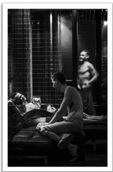
圖八：當地男同志三溫暖一隅。

荷蘭同志平權運動協會(COC Netherlands 6 )從 1946 年至今致力於為多元性別族群