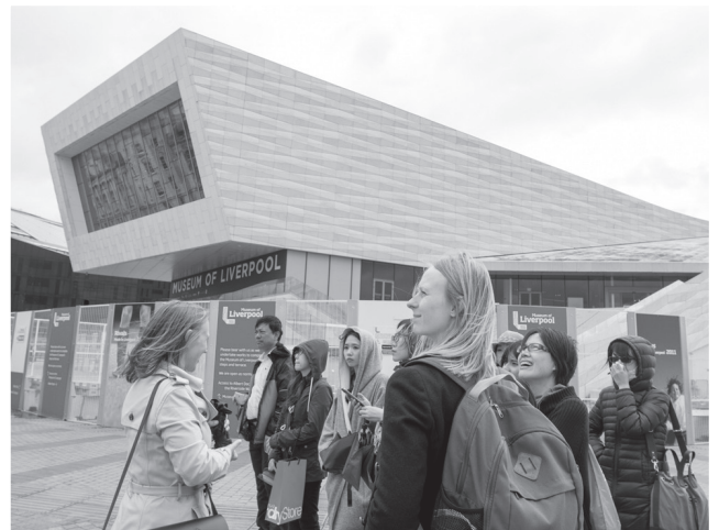
圖二：同學在利物浦實察上課照。

進到博物館，這裡博物館不用收費，可以免費入場，總共三層樓，第一層樓主要是在介紹利物浦整個城市的演進，從一開始的小市鎮到港口城市，裡面除了歷史之外，也有一些互動式的體驗及一些文物可供遊客拍照；二樓的部分有兒童區，主要是在教育孩童更加了解利物浦，因為時間的關係並沒有在此樓層多停留；三樓則是一些音樂和披頭四相關的收藏品，如海報、吉它等，