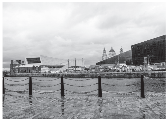
圖三：遠處的利物浦博物館。