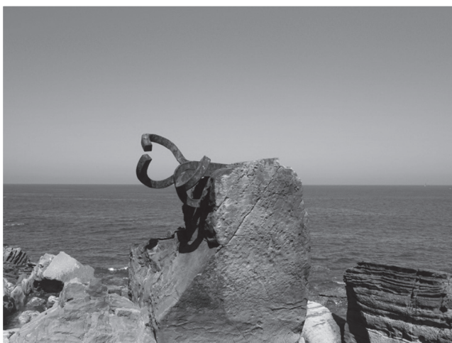
圖五：Peine del Viento。