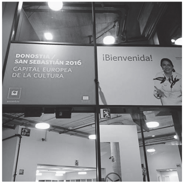
圖八：2016歐洲文化之都廣告。