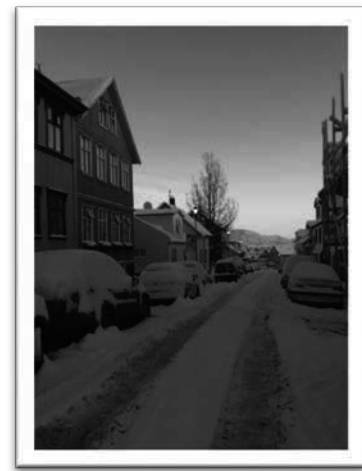
圖六：雪白的首都街景。