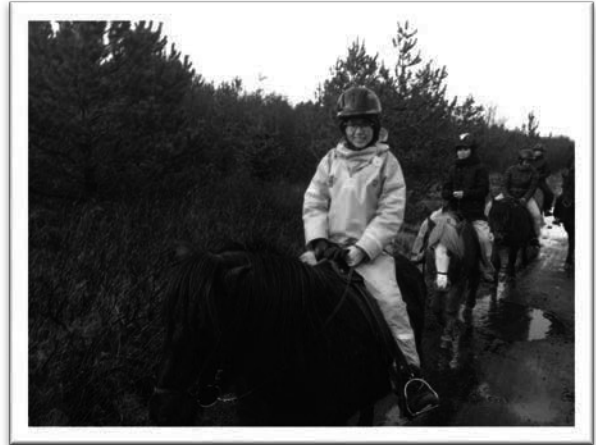
圖一：冰島馬騎乘之旅。