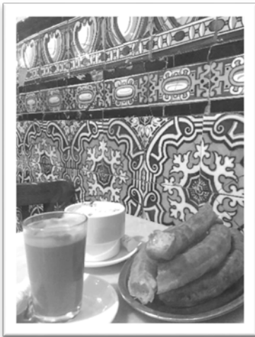
圖九：塞維亞傳統早餐吉拿棒(Churros)。