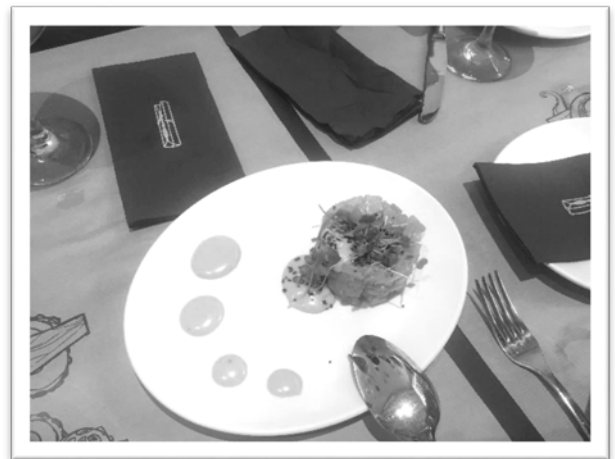
圖七、圖八由於住在史特拉斯堡，屬於內陸，及少吃海鮮，因此來到塞維亞，最愛點海鮮類的 tapas。