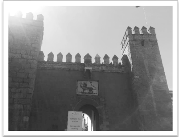
圖二：塞維亞王宮門口。

得教堂，以及倫敦聖保羅教堂。主教座堂原為清真寺，後來才改建成現在的塞維亞主教堂。教堂內可以發現許多清真寺拜樓與天主教的結合，教堂內的鐘樓曾是清真寺的宣禮塔，從清真寺改為教堂後，宣禮塔被保留下來，並於1987年被列為世界遺產。