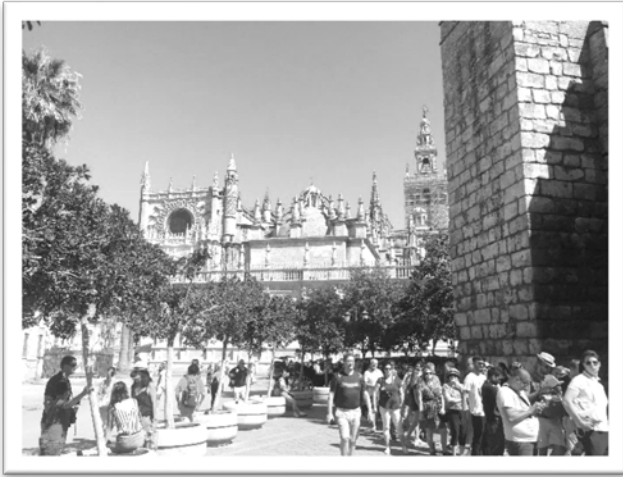
圖一：遠望主教座堂。