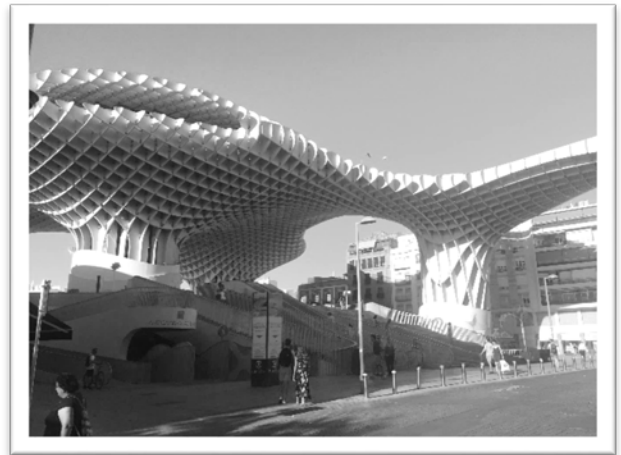
圖六：都市陽傘外觀。