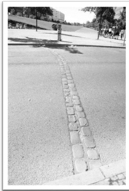
圖五：柏林圍牆痕跡。

一座城市內，卻處處提醒著人們她曾經是殘缺的。路上蜿蜒的圍牆遺跡、東德博物館、集中營、猶太人博物館。