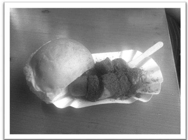
圖一：柏林小吃—咖哩香腸。

另外，宿舍配有功能齊全的廚房。或許是外食費用高，學生多半自己下廚，所以廚房內用品一應俱全，隨時都可以開伙。很多時候，我們都是在宿舍對面的超市買食材，在宿舍