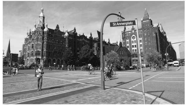
(圖三) 倉庫城與貿易商辦建築

在過去的一個世紀以來，市政府都妥善的管理這些因19世紀末到20世紀初期急速拓展的國際