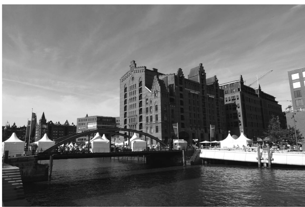
(圖四) 海港城與舊倉庫

這座古老的海港城市到了20世紀中後期，雖然港區都還是漢堡市的中心，但隨著過去幾世紀以來海港工業興盛之後，整個城市已經逐漸擴張