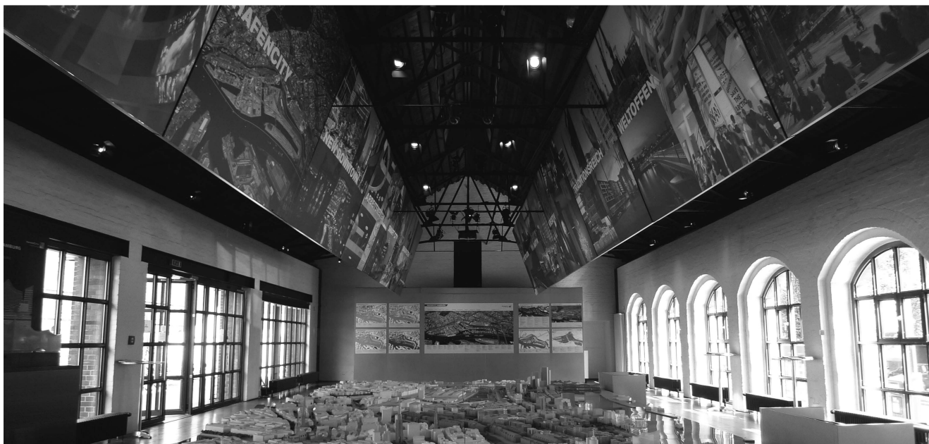
(圖六) 海港城未來規劃藍圖

成一個大都會區，港區和新興的中心商業區和歷史街區已出現了隔閡。直到近代，隨著歐盟自由貿易協定簽署之後，漢堡自由港的經濟產值逐漸消退，海港貿易與工業也日趨萎縮。面對這樣的情況，除了保存舊有港口區域與再利用，漢堡近代也著手於開發其他港邊區域的都市發展計畫。