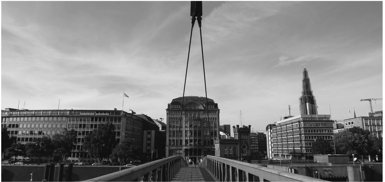
(圖七) 漢堡是一座充滿橋樑的城市

除了易北愛樂廳之外，市政府與建設公司也廣邀來自世界各地的知名設計師參加建築競圖，使得海港城與港區再生地帶成了建築師們爭相在此展示設計實力與作品的競技場。一座座新穎的建築物在海港城拔地而起，創造了滿是未來感的街景與描繪出新的天際線，與一旁來自過去海洋時代的倉庫城與貿易商辦建築群相互輝映著。透過漢堡港區大大小小的橋樑，可能是運河上的橋的或是天空中的橋，將不同時代串聯起來，並兼容並蓄地共同存在於城市之中，成為一個更大、更豐富的城市。