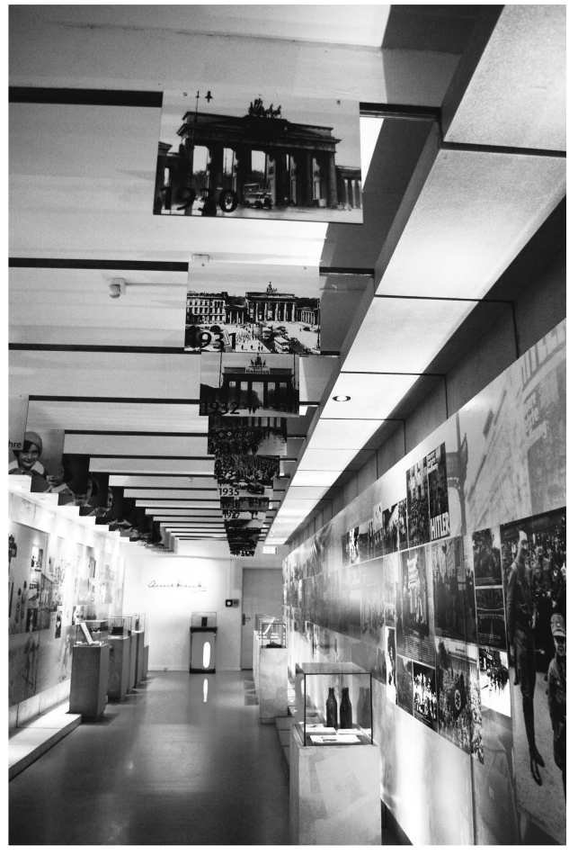
（圖九）安妮法蘭克中心主要展示空間

即使安妮法蘭克一家的命運最終以悲劇收場，但從《安妮的日記》以及不同的展示中我們可以感受得到這位猶太少女的生命依舊活躍於這