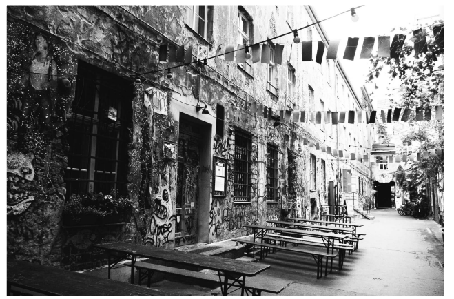
(圖七) 哈克雪庭院一角

在柏林最熱鬧又方便的米特區（Mitte）的亞力山大廣場（Alexanderplatz）旁，過去曾為20世紀新式集合住宅，現提供許多年輕人創業以及不同娛樂新興哈克雪庭院（Hackesche Höfe）裡（圖七），安妮·法蘭克這位世界知名的猶太少女也在這有著自己的小空間。（圖八）