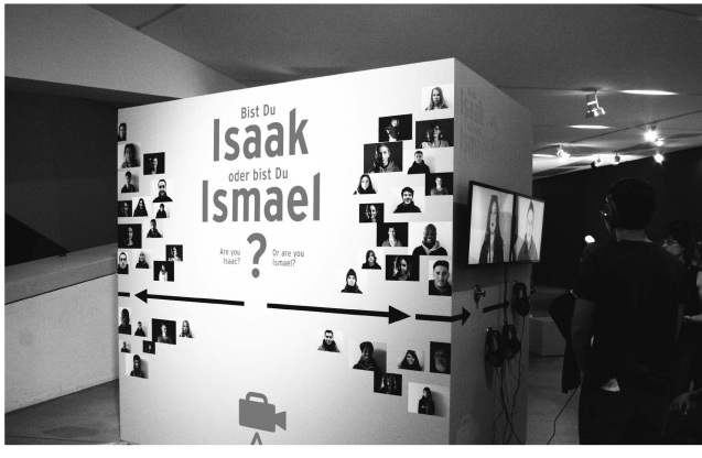
(圖六) Are you Isaac or are you Ismael

許多能夠動手翻閱或聆聽的資料外，我們也可以利用字母表，將自己的名字以猶太人所使用的意第緒語（Yiddish）拼出。