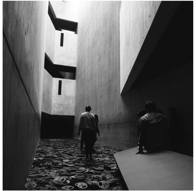
(圖三) 金屬人面體驗空間

踩踏與行走。當腳步踏進匡啷匡啷的聲響隨著步伐出現，與自上方灑落的光線相互映時，想起猶太民族曲折的命運心裡產生了許多複雜的感觸。