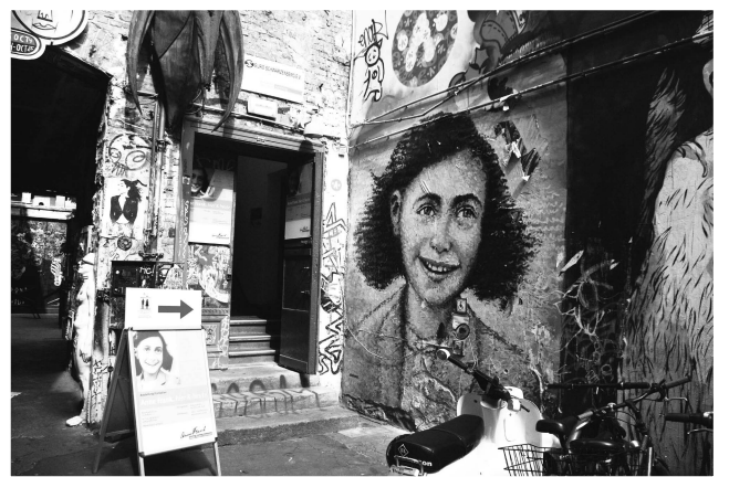
(圖八) 安妮法蘭克中心入口