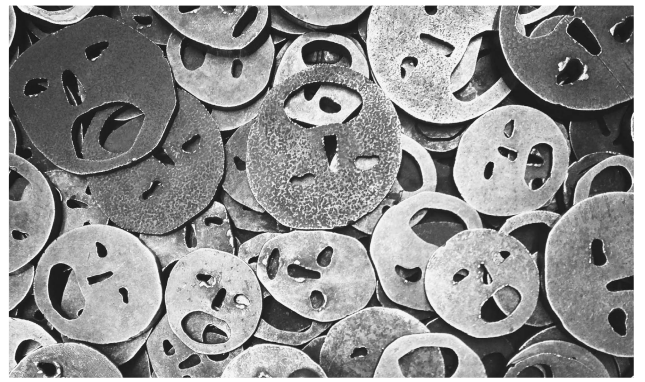
(圖四) 金屬人面體驗空間

(圖三、圖四)除了氛圍的感受之外，「Gallery of the Missing」這個開放式的聲響體驗也是一個非常有趣的設施。(圖五)當我們戴上耳機，靠近展場內任何一面全黑的牆，會發現牆面上不同的區塊會透過耳機播放不同的對話，有的對話急促緊張，有的對話仔細而小心翼翼，就怕被任何人聽見。