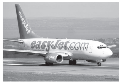
圖一：英國的EasyJet航空公司的飛機。

點卻是機場位置往往離市區較為偏遠（通常需要一兩小時車程）、登機行李皆有重量限制（每家公司限重規定不同，一般約為10公斤左右）及飛機的準點率不佳（有時恐會延誤數小時）。