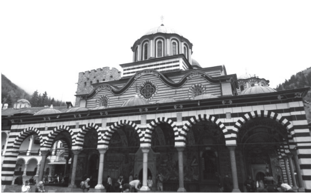
圖十四：索非亞近郊的里拉修道院。

進入保加利亞的首都索非亞（Sofia），我的東歐之旅變得更加精彩，「旅行中最美的風景始終是人」，我在莫斯特爾索非亞旅館（Hostel Mostel）遇到來自世界各地的旅人，我們一起旅行、吃飯、喝酒，互相分享東歐旅遊經驗並享受生活，甚至到現在都還保持聯繫；其中一位還在我從東歐回巴黎飛機誤點導致我錯過最後一班火車時，讓我借住她位在巴黎的家。我們一起造訪了索非亞近郊知名的里拉修道院，它是巴爾幹半島上最大的修道院，教堂內外充滿東正教的聖像畫屏、濕壁畫，描繪聖經故事、教會傳統和當地歷史，這真是非常美好的旅行經驗，能見識到如此美麗壯觀的東正教文化，同時又遇到一群心胸開闊的旅伴並成為好友。