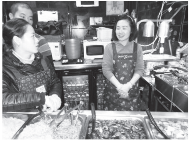
圖七：Camden Town Market的中國料理店。

很多人去歐洲自助旅行見到餐廳的價位後，就會默默打退堂鼓，改買超市的冷食和麵包果腹而面黃肌瘦，但筆者認為旅行一定要吃得好，白天才有體力盡情探索。如果住宿地點可提供煮食工具，就能省下許多開銷，住飯店的話，則可自