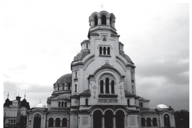
圖十五：索非亞的亞歷山大教堂。