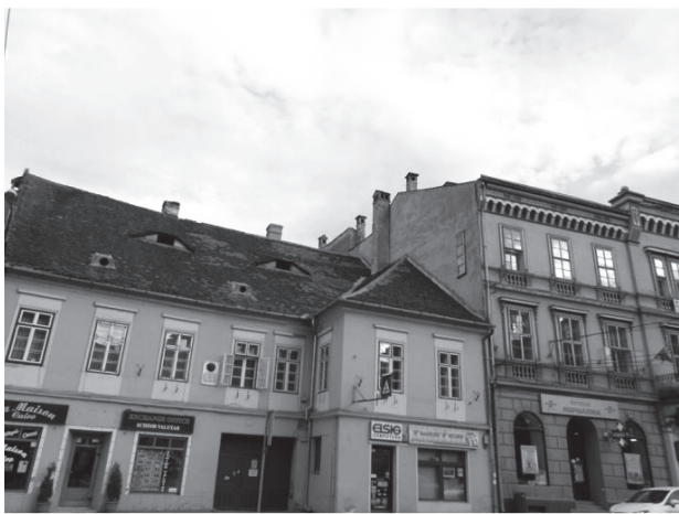
圖十一：錫比烏著名的「有眼睛的房子」。

布拉索夫（Brașov）最著名的莫過於德古拉城堡（Bran Castle）了，在城堡前還有一個小市集賣著各式各樣的吸血鬼相關產品，城堡裡的展示多和瑪麗皇后有關，和德古拉相關的倒比較少。事實上，據說德古拉確有其人，1431至1476年生活於瓦拉基亞，當時正是鄂圖曼土耳其帝國崛起的時候，他身為封建領主繼承人，殺戮土耳其人是他專長。1456年，他更做出許多可怕怪異的事，把前往他境內學語言的年輕男孩全部燒死，還把自己的人民剝光衣服，活埋至肚臍部位，然後用武器投射他們，此外，他還把一些人烤熟後剝皮，其中最可怕的刑罰是穿心刑，方法是拿木棒穿過人的身體。1476年，土耳其軍隊攻至德古拉的城堡，不久德古拉被殺，土耳其人砍下他的頭帶回伊斯坦堡，他的遺體據說葬在斯納格布湖中小島上的修道院。德古拉並不是吸血鬼，他只是因為殘酷嗜血而被小說描述成吸血鬼。