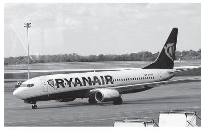
圖二：英國的RyanAir航空公司的飛機。