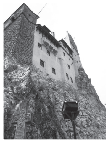
圖十二：德古拉城堡外觀。