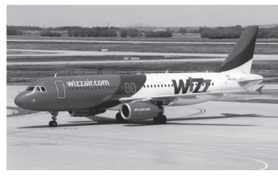
圖三：Wizzair航空公司的飛機。