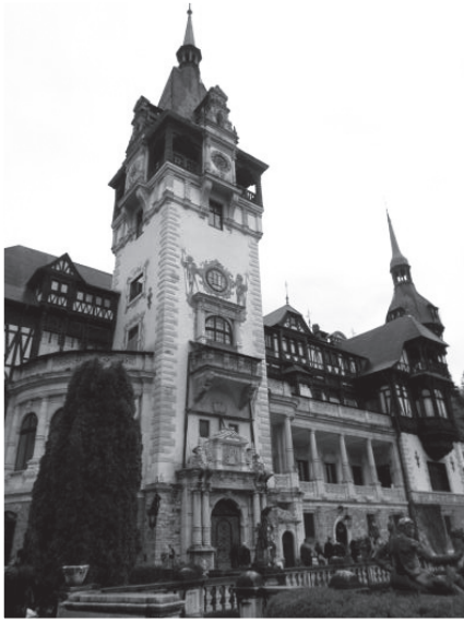
圖十三：帕麗斯城堡。

錫納亞（Sinaia）的帕麗斯城堡（Peleş Castle），是我目前為止參觀過最美的宮殿，我個人覺得勝過法國羅瓦爾河城堡群和凡爾賽，它是歐洲十大皇宮之一，於20世紀初完成，是羅馬尼亞最後一個國王卡洛斯一世親自設計的王宮，為典型的巴洛克建築，城堡三個塔尖直插雲霄；內部