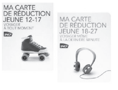
圖四：各種火車票優惠折扣卡。

若是選擇火車作為交通工具，就沒有行李限重的問題，且歐洲各國之間火車往來相當頻繁、便利，所以筆者通常選擇火車或是長程巴士作為國與國之間的移動工具。歐洲各國火車票若提早三個月前買票，還可以享有「早鳥票」優惠，通常多為半價優惠或更低廉，但缺點則是不能退票，一旦訂了車票，行程就被綁死。此外，使用歐洲火車聯票也是一個不錯的選擇，持法國學生居留證者，更可向當地火車站購買學生優惠聯票；在法國境內搭火車，如果低於 26 歲以下，還可以辦青年卡（carte jeune），每次搭乘都有近五折的優惠。