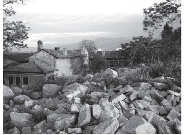
圖十七：普羅夫迪夫夕陽暈染古城之美。

索非亞最大的教堂莫過於亞歷山大教堂了，筆者很幸運，踏進教堂時恰好碰上東正教進行宗教儀式，主要教士頭戴黑色高帽手持檀香薰點各處，引領其他教士行進，筆者被東正教莊嚴的儀式及歌聲所震懾，那一刻深深感受到宗教的力量，感覺心靈被淨化，感覺塵世間的煩惱憂愁都離我遠去，不久，旁邊的女士對我招招手，帶領我走向前，並親吻聖像，那一切都那麼理所當然，那麼的祥和，我想我一輩子都忘不了東正教帶給我的強大平靜與安寧。