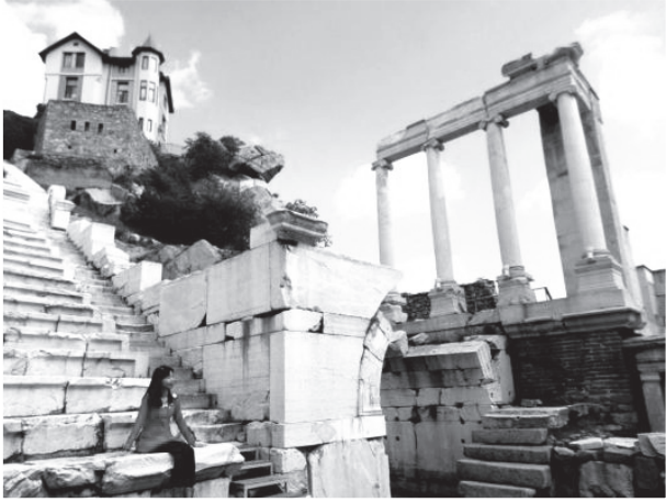
圖十六：普羅夫迪夫老城區的古羅馬劇場。