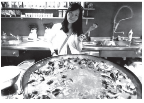
圖九：西班牙海鮮燉飯。

南歐國家如西班牙的小菜（tapas）更是一定要嚐嚐看，一盤也才2至5歐元不等，海鮮燉飯（paella）則是充滿各種海鮮配上特殊香料，一鍋約15至20歐元不等，價位不算太貴，這道菜回想起來依舊是令人垂涎三尺，好吃到筆者還特地去學怎麼做這道菜呢！義大利的披薩和義大利麵更是非吃不可的經典菜餚，路邊小店家販售的價位約5至10歐元不等；此外，義大利的冰淇淋更是一定要品嚐的甜點，口感可說是歐洲最佳，一球約2歐元，美味的提拉米蘇則約5歐元。