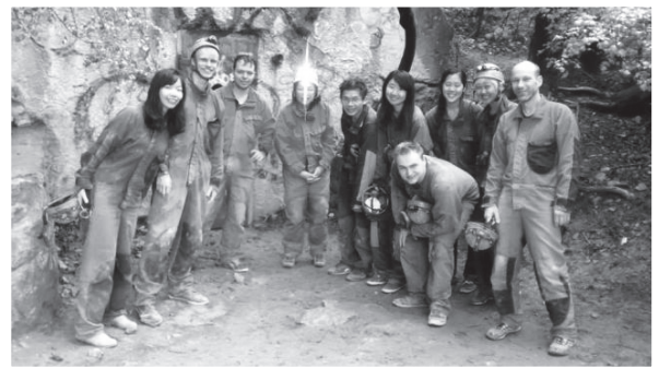
圖十：一同參與地下探險的旅伴們。

這趟旅程是筆者有史以來最精彩、最美好的自助旅行，在布達佩斯除了聽音樂劇和泡溫泉這些必去行程，我還參加了地下探險（underground caving），這是一種高耗體能的活動，必須爬或鑽過各式各樣的地下洞穴和通道，雖說很累人但是真的很有趣，一生真該體驗一次！而且和同隊隊友由於必須互助合作、互相提醒前方的路況，彼此間的關係也會變得很熟稔。日落後，在城堡山（castle hill）俯瞰布達佩斯的夜景，看著多瑙河畔靜靜沉思，是一件非常幸福的事！