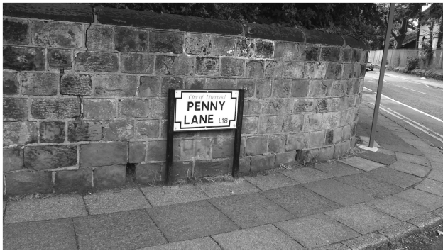
（圖三）因披頭四同名歌曲而聲名大噪的Penny Lane