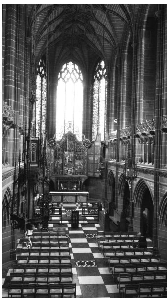
（圖五）寧靜的聖母堂

城市的遺產，不論有形或無形，都是屬於人們的集體記憶，也是城市獨特的元素之一。對遊客來說，利物浦的披頭四不僅僅是一個樂團，更多時候代表的是自己年少的美好時光，這也是為何許多樂迷不遠千里來到利物浦，透過音樂觀光的方式回到過去；而有形的建築，書寫了城市的歷史，也為不同的時代留下了記錄，生活在當地的人們可以在遺產裡追尋認同，而城市也能透過遺產，型塑出更美好的意象。