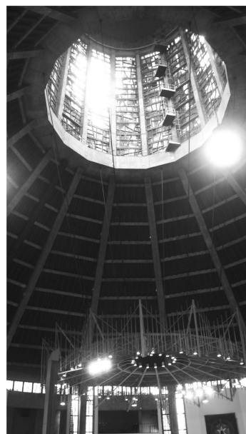
（圖七）大都會教堂內部