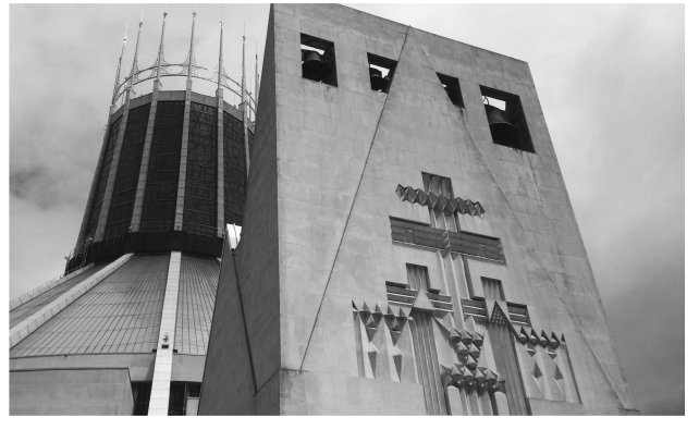
（圖六）具有現代感的大都會教堂

相較於外觀，教堂的內部又是另一番風景（圖七），不同於其他教堂的主祭壇多位於最前方，大都會教堂的祭壇位於本堂正中央，禮拜的長椅以同心圓的方式向外放置，抬頭仰望，看到的是塔樓的彩繪玻璃，設計師以鮮豔的紅、黃、藍三色裝飾，代表基督的三位一體，外圍則是以不同顏色為主題的各個小禮拜堂，教堂內部的大膽用色及現代感與外觀的冷峻色調形成強烈對