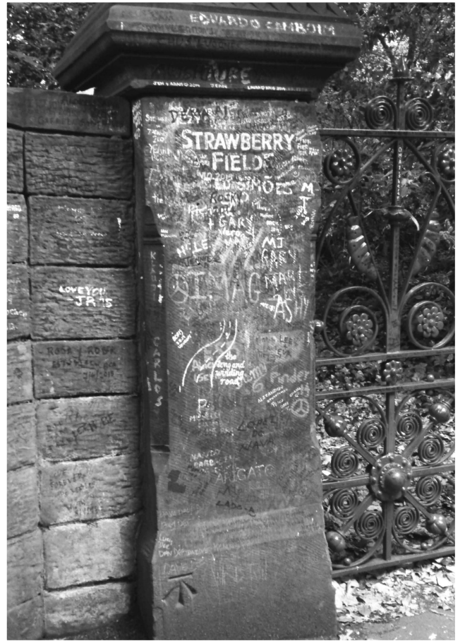
（圖二）於披頭四歌曲中出現的Strawberry Fields

低、點到點之間的距離較遠、景點多未受到特別的觀光化（如設置解說牌）等因素，我選擇了參加巴士團體導覽，期望能獲得豐富資訊與深刻體驗。在這趟為時2個小時的行程裡，導覽巴士帶領我們前往了許多景點，有些與樂團成員相關，如約翰藍儂舊家（Mendips）、保羅麥卡尼舊家（20 Frothlin Road）、聖彼德教堂（St Peter's Church Hall，此為約翰藍儂與保羅麥卡尼青少年時首次相識的地點）；有些則是歌詞性的景點，如Strawberry Fields Forever歌曲中出現的Strawberry Fields（圖二），這是慈善機構救世軍（Salvation Army）出資建造的育幼院名稱，也是約翰藍儂童年時與玩伴遊戲之處，育幼院已於2005年關閉，紅色的鐵門深鎖，但仍吸引許多觀光客在此駐