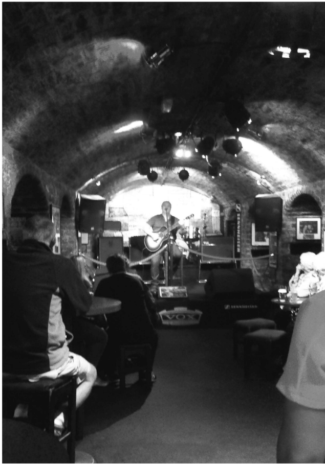
（圖一）在洞穴酒吧表演的歌手