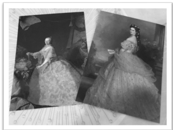
圖三：瑪莉亞·特蕾莎與茜茜公主的明信片。

瑪莉亞·特蕾莎女王全盛時期統治範圍包含當今奧地利、匈牙利、克羅埃西亞、米蘭等等。但她在即位之初面臨相當嚴峻的環境：諸侯們拒絕承認其合法王位繼承人的身分而引發戰爭、列強虎視眈眈地想從戰爭中獲取利益、長久以來稅收制度的不合理及王室的奢靡讓哈布斯堡王朝瀕臨破產、地方貴族擁權自重難以控制等等，但她憑藉個人魅力及驚人的政治謀略一一克服難題，致力於教育、軍事、農業、財政、貿易等各面向的發展與改革，將奧地利從一個外強中乾、統治者幾乎有名無實的危險狀態轉為國力強盛、名副其實的帝國，她也因此深受子民愛戴，有「奧地利國母」的美稱。她的私人生活也同樣精彩，她和丈夫經由自由戀愛成婚，這和當時往往因外交因素和素未謀面的另一半締結政治婚姻、無從選擇的王室貴族有很大的不同，相當難能可貴。她和丈夫共有十六名子女，但即便是歐洲第一女強人的兒女們也難逃政治聯姻的命運，所有子女中，她僅允許她最疼愛的一