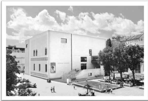
圖四：Leopold 博物館。

但她的故事卻不像童話中王子公主那樣的有美好的結局，她從小無拘無束，和家人住在距離權力中心數百公里遠的城堡中，自由地學習她喜愛的事物如騎馬、閱讀、寫作等等，但突然因婚姻被強迫住在皇宮之中，被繁文縟節、強勢的婆婆、喪子之痛壓得喘不過氣的