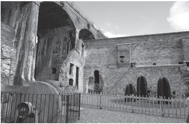
圖三：柯布魯克岱爾鐵博物館保存的工業遺跡。