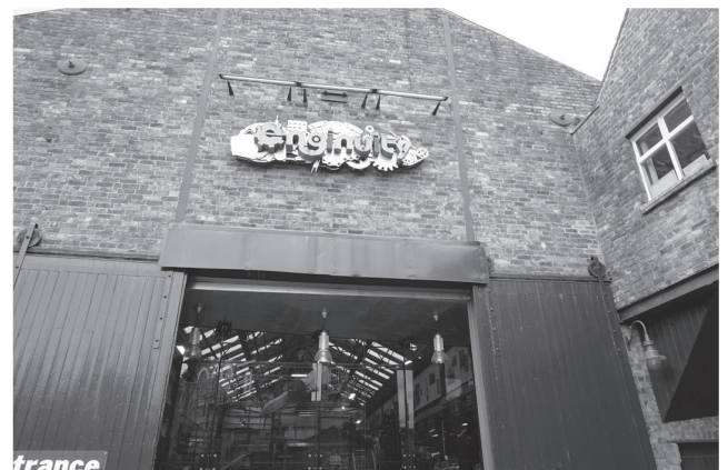
圖六：互動性設計的引擎動力館博物館。