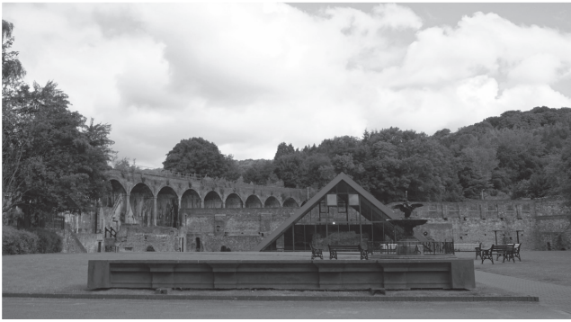
圖二：柯布魯克岱爾鐵博物館。