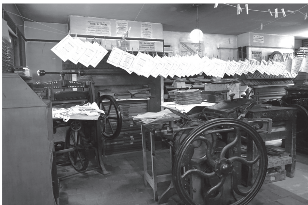
圖四：維多利亞時期的印刷店。

Ironbridge 官方網站 http://www.ironbridge.org.uk/ （最後檢索時間：2016年9月30日）