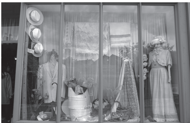
圖五：維多利亞城鎮裁縫店。