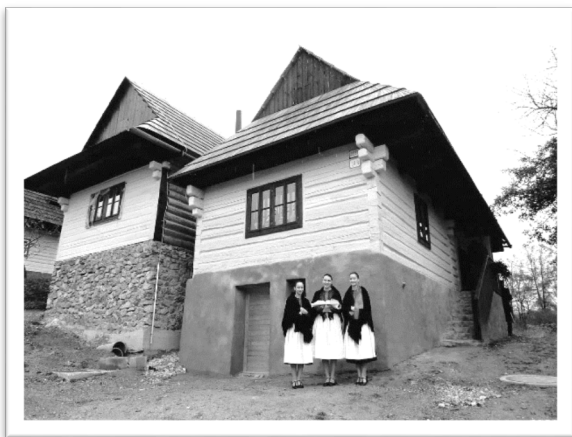
圖十：沃爾克林涅茨村的村民。

斯洛伐克至今仍然保持著週末或定期的市集傳統。除了售賣蔬菜和水果，也有相當一部分的攤位出售手工製品。很多心靈手巧的