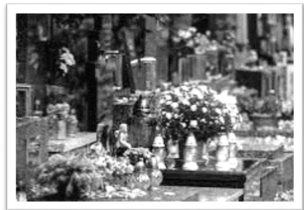
圖五：靈魂節時人們帶著鮮花悼念逝去的親人。

斯洛伐克文史學界公認的第一部有據可考的民俗傳說是《十二個月精靈》(O dvanást