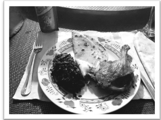
圖四：豐收狂歡節用來招待客人的餐點。

秋季重要的節日就是豐收狂歡節。這個習俗已經有幾百年的歷史。在斯洛伐克的高山地帶，自然環境嚴酷，無法進行傳統的農耕，因此村莊裏的青年男女都會遠離家鄉，到平原地帶的地主莊園工作。每年秋季完成田裏的收割，地主會犒勞家裏雇傭的年輕人，為他們舉辦派對，並且為他們分發酬勞。秋季正是鴨鵝最肥美的時候，地主會招待客人享用烤鴨或是烤鵝，配炙燒紫甘藍以及馬鈴薯薄餅(圖四)。久而久之，這個習俗延續至今，每到