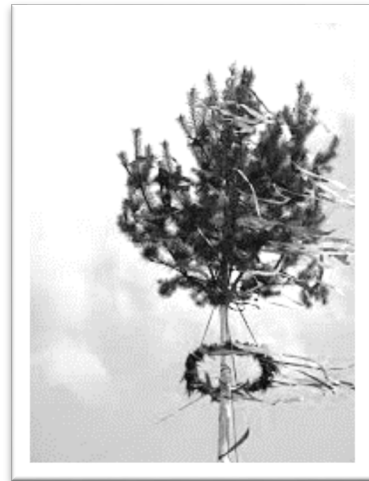
圖二：繫滿了綢帶的柏樹。