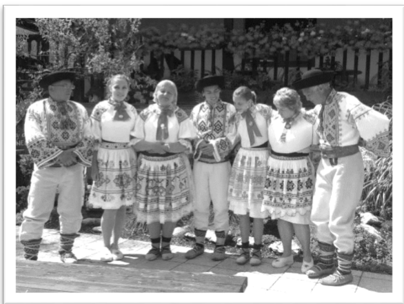
圖八：豐富多彩的傳統民俗服飾。

斯洛伐克的傳統民俗服飾非常豐富多彩，布料的質地以及顏色的選用，都與服裝的用途息息相關：可以分為節慶禮服、喪葬禮服、婚禮慶典禮服、豐收狂歡禮物以及平日勞作