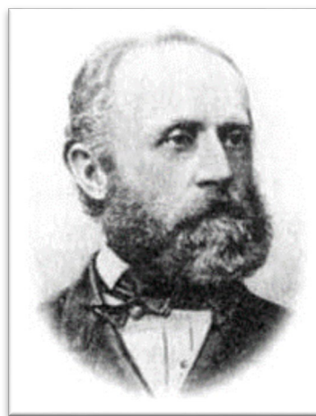
圖七：保羅·道布什英斯基。