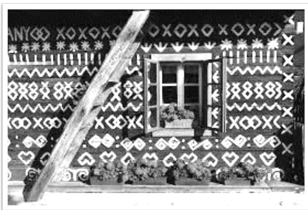
圖十二：齊馳瑪尼村房屋外牆的精美手繪圖案。

老人們自己製作氈帽和拖鞋，她們用手編製桌布和桌巾。她們的製作手法非常獨特，其中不但包括刺繡等傳統的針線手藝，還有鏤空、挑絲等獨門絕活。