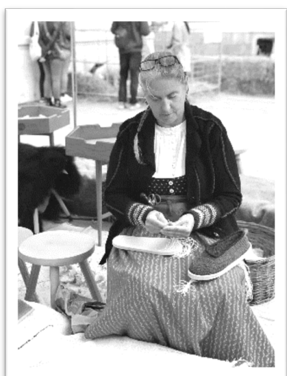
圖十三：手巧的村民自製氈帽和拖鞋。

(本文作者為斯洛伐克考門斯基大學斯洛伐克語言博士，目前任職於駐台斯洛伐克代表處工作)