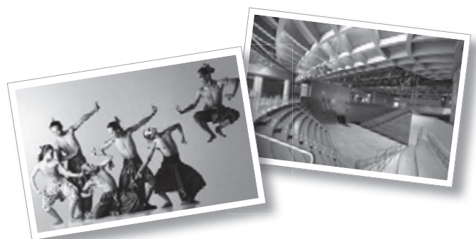
圖三：館內Claude Lévi-Strauss劇場演出當代非洲舞蹈